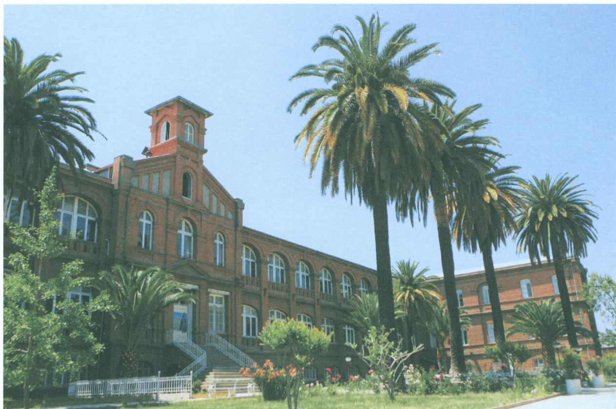
Fachada principal del asilo.