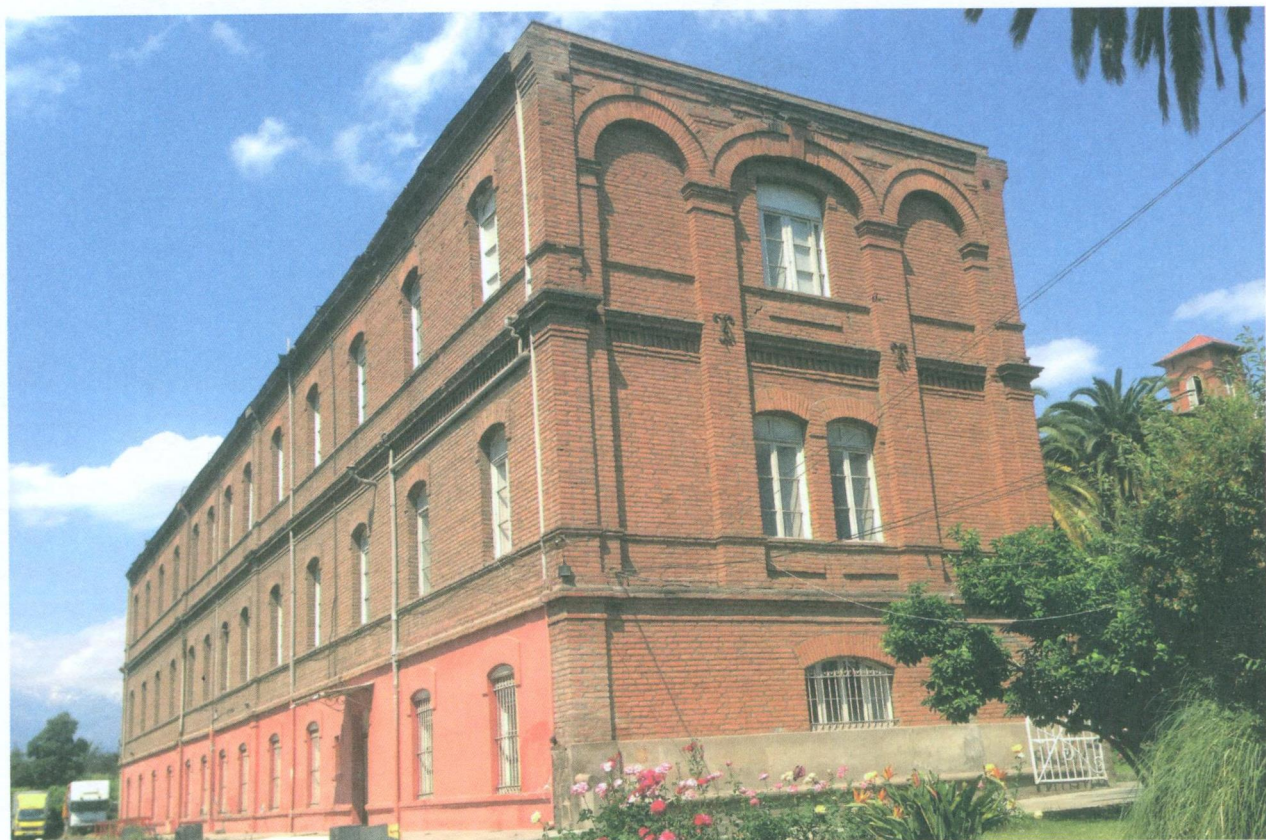
Nave lateral del asilo.