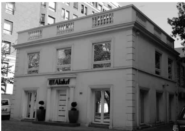
FIGURA 2: EDIFICIO DE OFICINA DE SERVICIOS PROFESIONALES UBICADO EN CALLE HENDAYA NRO.263.