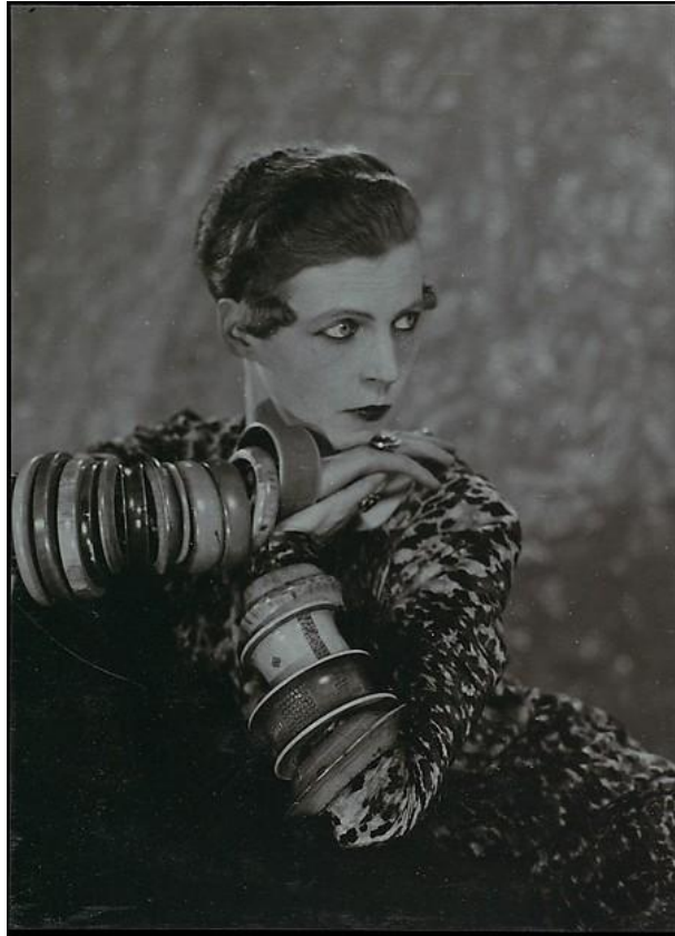
Figura 6. Man Ray, Nancy Cunard , 1926.

proyecta a la libertina en el papel de creadora y asigna al escritor el papel femenino, reconociendo de este modo la naturaleza bisexual del creador” (Kristeva 1999, p. 233- 234).