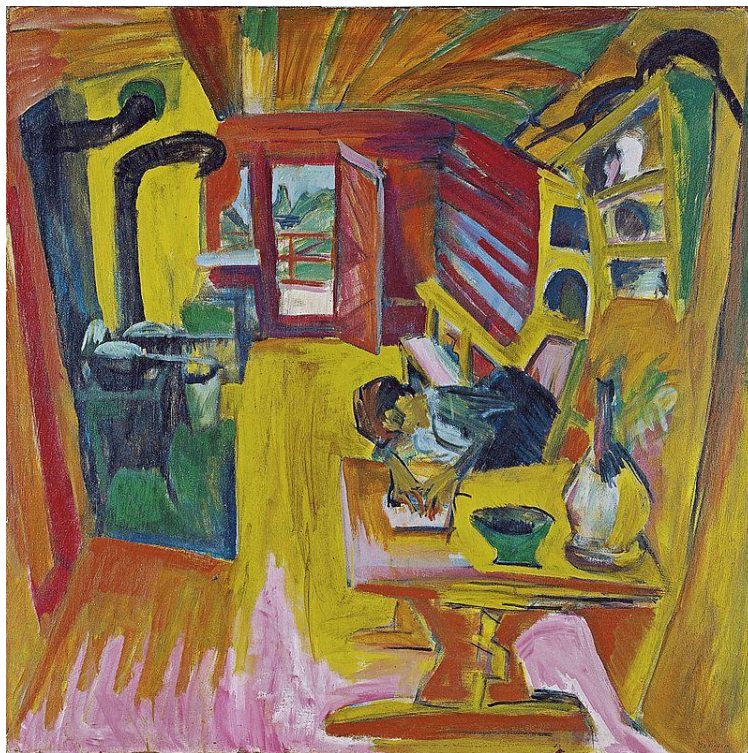
Figura 4. Ernst Kirchner, Cocina alpina , 1918.

Otra posibilidad emerge si distinguimos el movimiento romántico de las vanguardias emergidas tras la primera guerra mundial. La literatura romántica, si bien se acercó a un encuentro con lo imposible (Kristeva 1999), permaneció más cerca del plano simbólico que los movimientos posteriores (contemporáneos a Freud) como el expresionismo y las vanguardias dadaísta y surrealista.