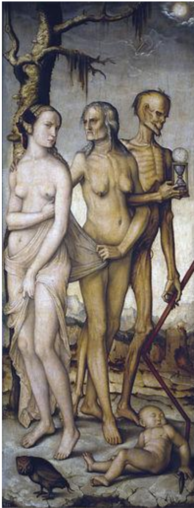
Figura 1: Hans Baldung, The three ages of man and death , 1510.

con una interpretación alegórica del motivo. Las tres mujeres representan los tres vínculos inevitables del hombre para con la mujer; la paridora, la compañera y la corrompedora, o bien, las tres formas que toma la imagen de la madre a lo largo de la vida; la madre misma, la amada y la madre tierra (Figura 1). “ El hombre viejo en vano se afana por el amor de la mujer, como lo recibiera primero de la madre; solo la tercera de las mujeres del destino, la callada diosa de la muerte, lo acogerá en sus brazos ” (ibídem, p. 317).