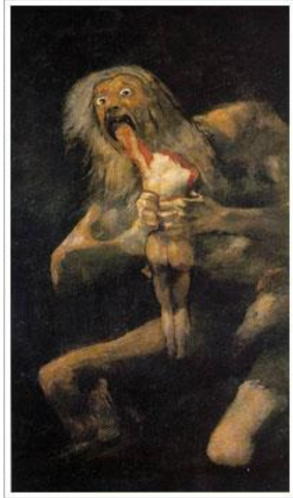
Figura 3. Goya, Saturno devorando a su hijo , 1819-1893.

Freud continúa citando Los elixires del diablo , novela de Hoffmann en la que estarían presentes múltiples elementos evocadores de lo ominoso; la presencia de dobles, el salto de procesos anímicos de una persona a la otra (telepatía) 43 , la identificación con otra persona hasta equivocarse sobre el propio yo (duplicación, permutación, división del yo) 44 , y el permanente retorno de lo igual (rasgos faciales, caracteres, destinos, hechos criminales y nombres).