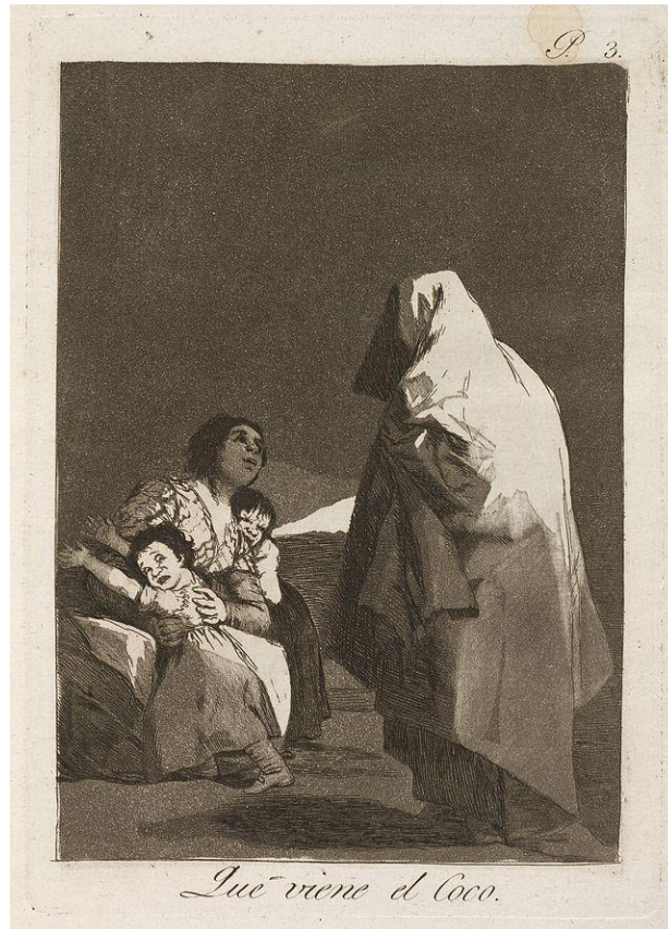
Figura 2. Goya, Que viene el coco , 1797.

Este siniestro personaje atormenta durante todo el relato a Nathaniel, el protagonista del cuento, presentándose bajo diferentes formas, llevándolo finalmente a la muerte. De la experiencia analítica Freud extrae que el dañarse los ojos es una fantasía que atemoriza a los niños y es con frecuencia un sustituto de la angustia de castración (aquí nos recuerda a Edipo, quién se ciega a sí mismo como castigo). Entonces el cuento entero cobra pleno sentido al sustituir el Hombre de la Arena por el padre, de quién se espera la castración. La angustia ante el Hombre de la Arena es reconducida entonces hasta la angustia del complejo de castración (figura 3).