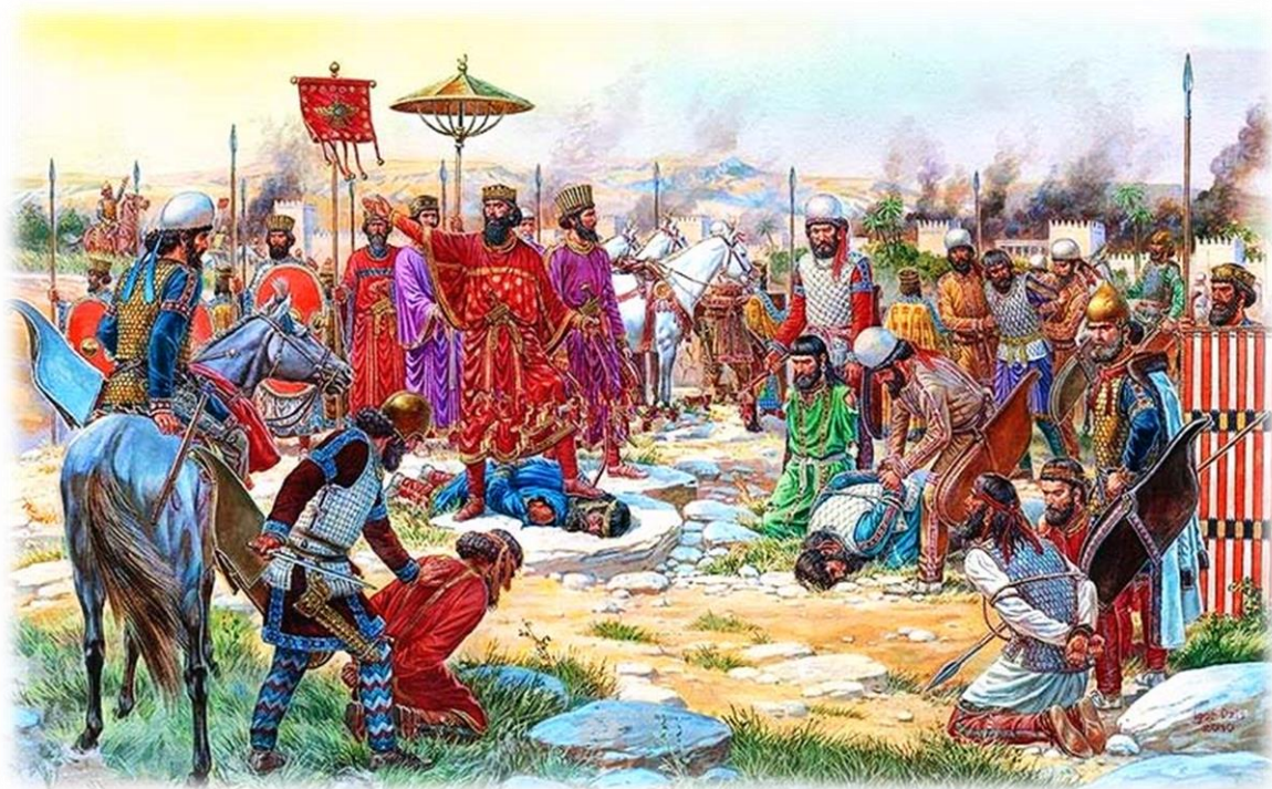
Ilustración 10: Rendición de los “rebeldes” elamitas ante Darío por el ilustrador ucraniano Igor Dzis (2010), basado en el relieve de Behistún. Nótense las ropas medas vestidas por las tropas en campaña, tanto entre “rebeldes” como entre las tropas del Gran Rey, Darío y su séquito por su lado llevan las tradicionales túnicas elamo-persas que pasaron a ser la nueva norma de la corte.

La contra-revuelta triunfó y Darío siendo uno de los mejores candidatos para reclamar la legitimidad al trono como pariente de sangre y Familiar de confianza de Cambises, fue coronado Gran Rey de Persia. La victoria de Darío fue celebrada por los persas de ahí en adelante, según Heródoto y Ctesias (Nichols, 2008, pág. 93), en una fiesta anual llamada ‘masacre de magos’ (Gr. Magophonia ), celebrada el día de la muerte del usurpador, que según las fuentes antiguas era un mago usurpando el rol de Bardiya , según Heródoto el día de la muerte del usurpador se dio tal caza a los sacerdotes “ que si no hubiera llegado la noche, no quedarían ya magos ” y que para conmemorar ese día los persas celebraban con grandes banquetes a los que ningún mago podía asistir o incluso mostrarse en público (III, LXXIX); Ctesias por su parte no aporta nueva información, ya que sólo nos dice que era un festival para celebrar la muerte del mago Sphendadates/Gaumata/Bardiya .