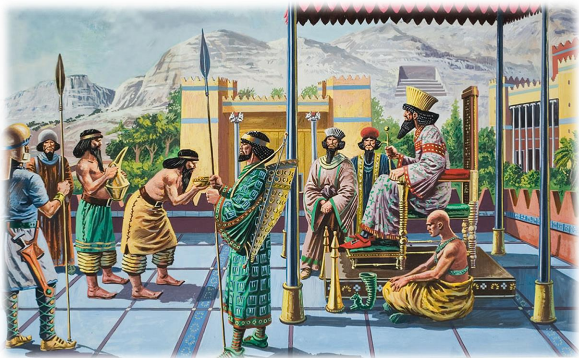
Darío I recibiendo emisarios con tributos durante la ceremonia del Nowruz, basado en los relieves de Persépolis.