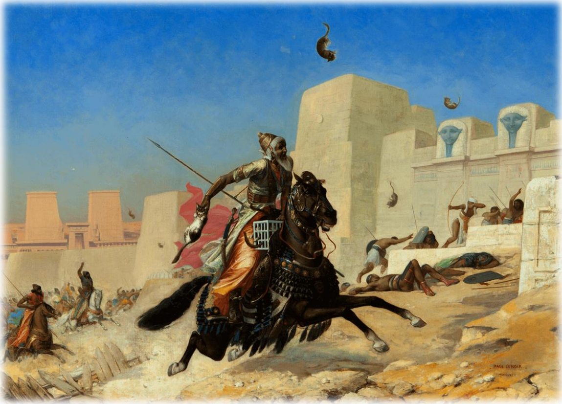
Ilustración 8: Cambises y sus tropas arrojando gatos a las defensas egipcias en Pelusio. Pintura de Paul-Marie Lenoir, 1872.

miedo a dañar a sus animales sagrados, esta anécdota probablemente nunca haya ocurrido ya que sólo es mencionada por Polieno.