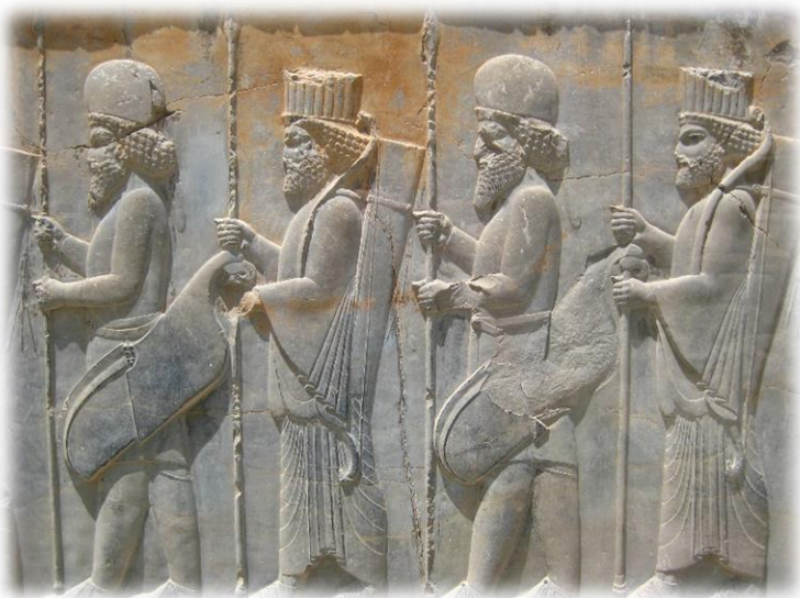
Ilustración 6: Portadores de Manzana representados en los escalones del salón de recepciones de Persépolis (Apadana). Nótese la mezcla de vestimentas medas (primero y tercer de izquierda a derecha) y elamo-persas (segundo y cuarto).

destinados lejos de su madre patria, protegiendo la Pax Pérsica y garantizando la justicia del Rey; los famosos y mal llamados ‘Diez mil Inmortales’ 9 , una división ( baivarabam ) considerados los mejores y más valientes soldados de a pie del Imperio, de estos, un regimiento o hazarbam (1.000 hombres) servía como Guardia Real, llamada ‘Lanceros Personales del Rey’ ( Arstibara ). El comandante de este hazarbam recibía la denominación de hazarpatis , al igual que cualquier otro comandante de regimiento, pero el hazarpatis del imperio un poder muy superior al que su rango sugiere, ya que era designado personalmente por el Gran Rey y detentaba el mando supremo de la Spada , siendo uno de los hombres más influyentes de la corte, incluso sabemos que en la época más tardía el hazarpatis imperial llegó a desempeñar las funciones similares a las de un Primer Ministro 10 (Farrokh, Shadows of the Desert , 2007, pág. 40).