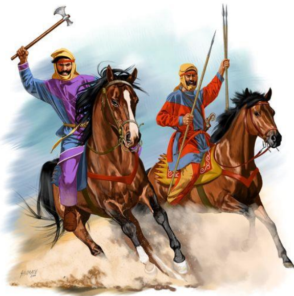
Ilustración 7: Familiares armados de la segunda mitad del siglo IV a.C., los caballeros persas privilegiaban armas a distancia como arcos y jabalinas. En cuerpo a cuerpo las armas más populares eran las dagas largas (akinakes) y hachas (sagaris), una sagaris casi mata a Alejandro Magno en la batalla del Gránico. Como miembros de la Spada, los uniformes de combate de los Familiares son de estilo medo y muestran el color de la unidad a la que pertenece su respectivo jinete. Ilustración de Johnny Shumate.

hombres de confianza, ser un 'Familiar' del Gran Rey era un título nobiliario no hereditario que dependía de la cercanía personal entre el Rey y el noble, un Familiar podía ser nombrado o destituido por el Rey en cualquier momento por razones personales, ya que era el vínculo personal lo que más importaba y lo que los jerarquizaba internamente (Farrokh, Shadows of the Desert , 2007, pág. 40), mientras mayor su cercanía al Rey mayor su importancia, por ejemplo, Darío sirvió como 'Portador del Gorytos 12 del Rey' con Ciro y como 'Portador de la Lanza del Rey' con Cambises, lo que nos da a entender que tenía un lugar importante dentro de la corte real.