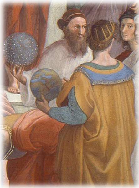
Ilustración 2: Zarathustra en la Escuela de Atenas (1511), basado en el rostro de Baldassare Castiglione. Pintado por Rafael Sanzio.

La principal fuente para resolver esta problemática son los Gathas . El estudio de estos