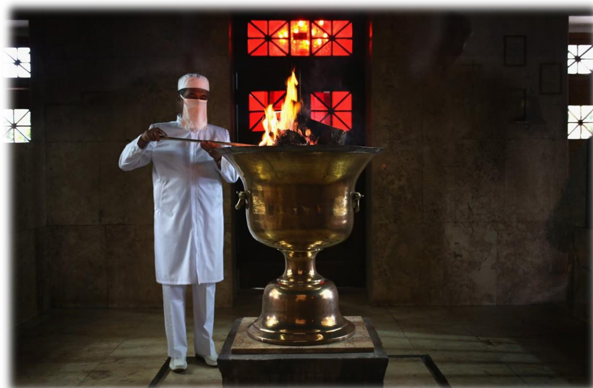
Ilustración 4: Un Mobad (Sacerdote zoroastrista) custodia el Atash Behram (Fuego de la Victoria), la forma más elevada de Fuego Eterno en el zoroastrismo actual. Foto tomada en el templo de Yazd, donde sus clérigos reclaman que la llama arde desde el siglo V.

A partir de Darío, podemos evidenciar que todas las inscripciones reales persas mantienen la misma forma de presentación, dedicando a Ahura Mazda sus mayores logros, lo que es un fuerte argumento para considerar al zoroastrismo como una fuerte influencia al interior de la corte del Gran Rey. Incluso cuando la ortodoxia zoroastrista se vio amenazada por las prácticas sincréticas de los aqueménidas, Ahura Mazda nunca perdió su puesto hegemónico en el panteón real, el mejor ejemplo de esto se dio en el gobierno de Artajerjes II, donde el culto de Anahita , diosa de la fertilidad, se esparció por el imperio bajo patronazgo real y sobretodo de mano de la reina madre, pero incluso esto no impidió a Ahura Mazda mantenerse como la figura central de entre las deidades de la corte, los documentos reales seguían siendo consagrados en nombre de Ahura Mazda , que a pesar de compartir el patronato con Anahita en documentos del reinado de Artajerjes (Briant, 1982), siempre se le invocaba antes que la diosa de la fertilidad, lo que solo nos prueba la consagración y legitimidad del zoroastrismo como símbolo de poder y autoridad religiosa.