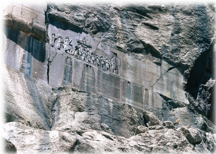
Ilustración 1: Inscripción de Behistún.

Es muy raro encontrar narraciones históricas escritas legadas por la Persia Aqueménida. Gran parte de las fuentes primarias consistían en cueros de animal escritos, enrollados y almacenados en un recinto especial de la ciudadela de Persépolis, que se perdieron durante el incendio que