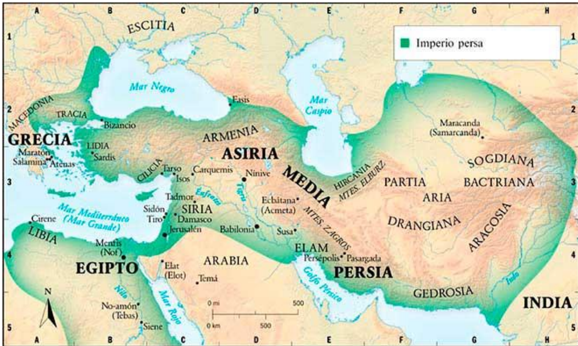
Ilustración 11: Mapa del Imperio en su máxima extensión, durante el reinado de Darío.

Ciro es considerado con mérito como el fundador del imperio persa aqueménida y símbolo de la nación irania hasta el día de hoy, mientras su hijo Cambises ha sido recordado malamente por la Historia, quizás sin merecerlo. Pero es Darío quien reformó la Persia Aqueménida hasta darle una forma que nosotros podemos reconocer como un verdadero imperio. Con un sistema estatal de obras públicas, un entramado legal universal, el primer sistema monetario estandarizado del mundo, un reformado sistema burocrático, un rescate de la antigua cultura persa en la corte en detrimento de la meda, una nueva capital para los persas y una nueva religión cortesana que funcionó como soporte ideológico para el reformado imperio.