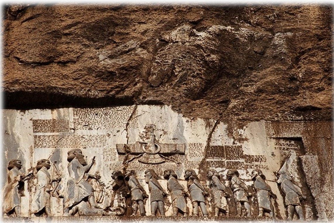
Ilustración 9: Detalle del relieve de Behistún, junto a Darío posan su portador de lanza y su portador de arco y hacha, identificados en su tumba de Naq-i-Rustam como sus coconspiradores, Gobryas (DNc) y Aspathines (DNd), quienes muy probablemente disfrutaron la confianza y la generosidad del Gran Rey. Es interesante hacer notar que el gorro de Skunkha, hace honor a su título como el líder de los sakā tigrakhauda o escitas de los sombreros puntiagudos.

de que este les devolviera sus privilegios, mientras que a su vez acalló el culto que se le rendía a la memoria de su hermano en su âyardana personal.