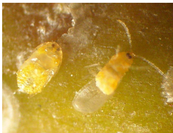
Figura 4. Pupa y Macho adulto de escama de San José

Se le denomina ninfa de primer estado, a aquella cuyo desarrollo se encuentra comprendido entre el nacimiento y la primera muda. Dentro de este período puede identificarse la ninfa móvil o larva migratoria (Fig. 5), gorrita blanca y gorrita negra. A continuación, ocurre la primera muda y a partir de este momento se le conoce como ninfa de segundo estado o gorrita gris, estadio que evidencia las primeras diferencias entre hembra y macho, donde este último comienza a alargarse conjuntamente con su escudo, mientras la hembra continúa con su aspecto circular. Ya en el tercer estado se hace evidente tal diferencia, dando paso al desarrollo diferenciado de ambos hasta su madurez sexual (Charlin y Sazo, 1988).