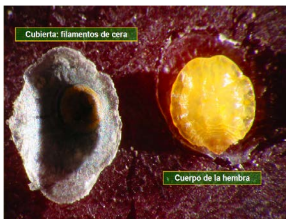
Figura 3. Hembra adulta de escama de San José y su escudo

Se sabe que el desarrollo de los Diaspíridos, se verifica a través de metamorfosis diferenciada para ambos sexos. Así, la hembra pasa sólo por dos estados juveniles antes de alcanzar la madurez sexual en el tercer estadio, conservando siempre su aspecto juvenil bajo el escudo y por eso se le califica como hembra “neoténica” (Fig. 3). El macho en cambio pasa por 4 estados previo a su emergencia como imago (2 ninfales y los estados de pre-pupa y pupa), conservando características de insecto adulto (Charlin y Sazo, 1988) (Fig. 4).