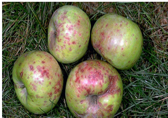
Figura 2. Escama de San José sobre manzanas.