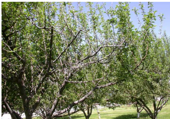
Figura 1. Árbol de manzano muerto por ataque de escama de San José.

Los árboles una vez infestados, presentan un decaimiento en el vigor, crecimiento y productividad. En niveles altos de infestación, las ramillas se ven encostradas a causa de la escama, y tanto ramillas como ramas principales, pueden secarse completamente. Ahora bien, en la fruta, en especial sobre manzanas, la mayor presencia se encuentra en la cavidad calicinal, dañando cosméticamente la fruta mediante una apariencia manchada o moteada ya que cada escama produce una coloración rojiza en su alrededor (Fig. 2) (Welty, 2009).