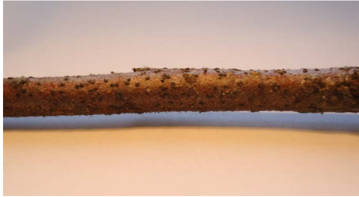
Figura 6. Ramilla de manzano severamente infestada, utilizada en la evaluación, donde se aprecia una gran población de gorritas negras.

Los tratamientos ensayados se presentan en el cuadro 1.