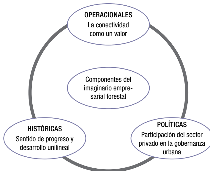
Figura 3. Componentes del imaginario empresarial forestal en la ciudad de Concepción

En 1974 existían en el país 300 mil hectáreas y una industria de celulosa, se generaban 8 mil empleos y las exportaciones no eran nada, nada. Hoy día tienes 300 mil personas que tienen trabajo estable que están viviendo y se están desarrollando (Representante de Corma, comunicación personal, 5 de noviembre de 2015).