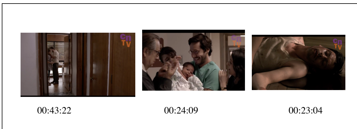
*Figura 25. Elaboración propia, con imágenes extraídas de Los Archivos del Cardenal (Temporada 2, capítulo 12)

Es en este tiempo de transición encarnado en el consenso chileno que se da una democracia en la medida de lo posible, donde esta lucha por el poder representado en el triángulo amoroso a través de la reflexión inicial acerca del Orden-Desorden da pie a pensar en los tres personajes como metáforas de las tres posiciones políticas hegemónicas de Chile: la izquierda, el centro y la derecha.