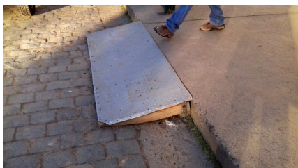
Imagen 4. Quinta Normal. La accesibilidad resuelta mediante soluciones que no abordan el problema de fondo.