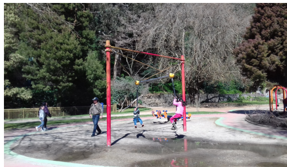
Imagen 3. Ejemplo de la incomprensión del contexto y los usos reales del equipamiento.

El estudio de casos permitió constatar que la intervención inclusiva es insuficiente y no responde a las necesidades de los usuarios reales. Asimismo, el equipamiento ‘inclusivo’ existente no está integrado en sus diversos componentes de manera sistémica. Se observa que las soluciones propuestas son de tipo estándar y, muchas veces, no satisfacen las prácticas de aquellos usuarios sin problemas de accesibilidad (imagen 3).