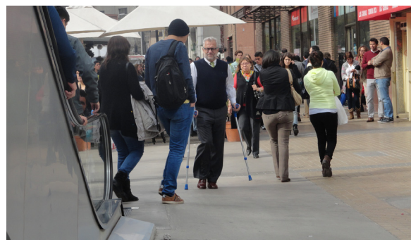
Imagen 1. El reconocimiento de la diversidad como enfoque inclusivo.

METODOLOGÍA. La metodología aplicada contempló tres momentos. Primero, se efectuó una revisión exhaustiva de bibliografía pertinente, concentrada en trazar la problemática conceptual de la inclusión y, especialmente, en la elaboración de una propuesta propia del concepto de inclusividad. A esto se agregó el análisis de las 15 publicaciones nacionales periódicas más relevantes en el ámbito de la arquitectura y el urbanismo (tabla 1). En seguida, se efectuó una sistematización y análisis de contenido de la Ley N°20.422, poniendo especial énfasis a la OGUC y al Decreto N°50. Finalmente, se elaboró un instrumento de observación y análisis en terreno, articulando elementos conceptuales y legales. Este instrumento fue denominado ‘ficha de evaluación inclusiva’ y con él se hizo posible desarrollar un levantamiento planimétrico, un registro fotográfico y un análisis de las condiciones espaciales de tres casos de estudio seleccionados. El levantamiento de información de los tres casos se realizó durante el segundo semestre de 2017.