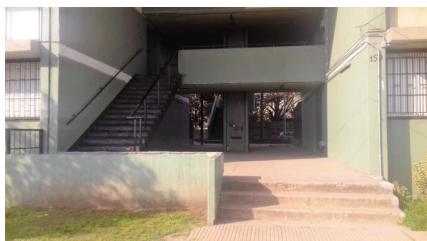
Imagen 5. Villa Portales. La ausencia de rampas y las malas condiciones del ingreso no permiten la accesibilidad a la vivienda.