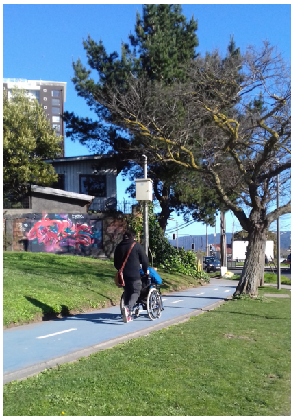
Imagen 2. Cómo aparecer o desaparecer en la ciudad.

En la historia chilena reciente, el año 2010 marca un hito en la perspectiva de la inclusividad. El 10 de febrero de ese año fue publicada en el Diario Oficial la Ley N°20.422, que establece normas sobre igualdad de oportunidades e inclusión social de personas con discapacidad, y cuyo objetivo es “asegurar el derecho a la igualdad de oportunidades de las personas con discapacidad, con el fin de obtener su plena inclusión social, asegurando el disfrute de sus derechos y eliminando cualquier forma de discriminación fundada en la discapacidad” (Ministerio de Planificación, Gobierno de Chile 2010, artículo 1°). Esta ley vino a reemplazar a la Ley N°19.284, promulgada en 1994, que establecía las normas para la plena integración social de personas con discapacidad. La Ley N°20.422 se organiza a partir de una serie de principios (artículo 3°), entre los que cuentan: la intersectorialidad, la vida independiente, la accesibilidad universal,