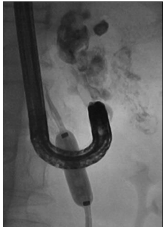
Figura 3. Por vía transparietohepática se accedió al sistema portal y se ocluyó shunt anterógrado gastroesplénico. Por acceso femoral se accedió al territorio sistémico y se ocluyó shunt retrógrado gastrorrenal. En la figura se observa inyección de cianoacrilato directo sobre las varices.

La terapia mediante BRTO tiene la ventaja de aumentar el flujo hepático, por lo que se puede