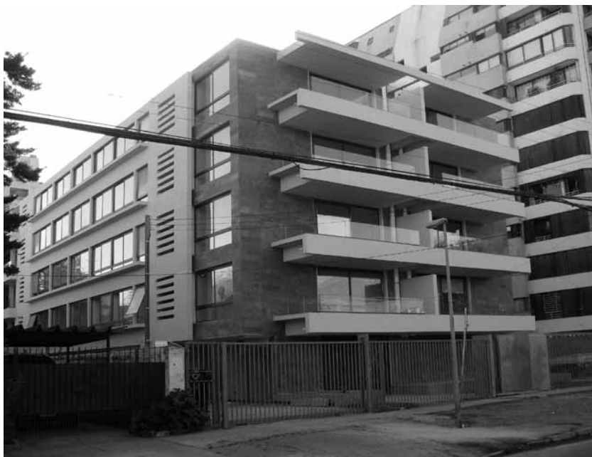
FIGURA 9: EDIFICIO CON DESTINO HABITACIONAL UBICADO EN CALLE MARTÍN ALONSO PINZÓN NRO. 6914