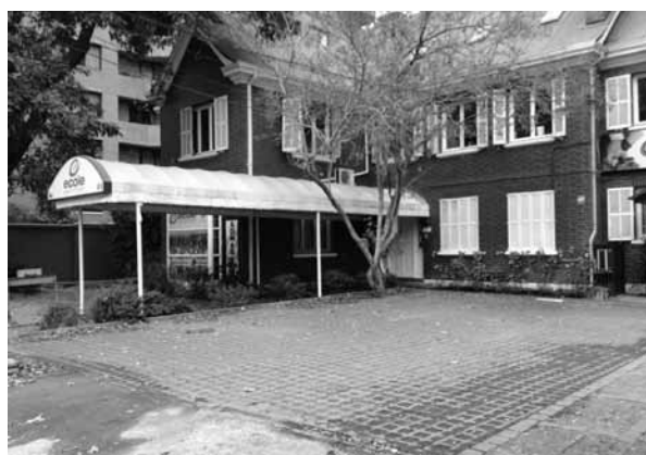
FIGURA 3: EDIFICIO DE EDUCACIÓN SUPERIOR, ESCUELA DE COCINA EN AVDA. AMÉRICO VESPUCIO SUR NRO.930.