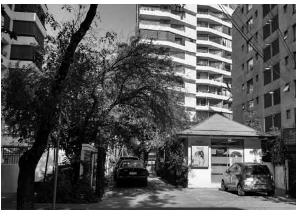
FIGURA 4: SALÓN DE BELLEZA Y PELUQUERÍA UBICADA EN CALLE NAPOLEÓN NRO.3375.