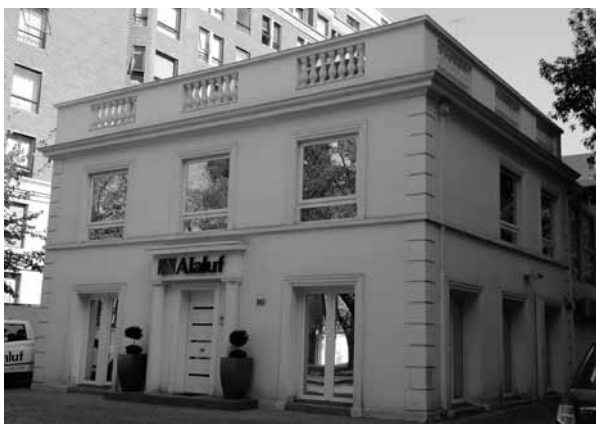
FIGURA 2: EDIFICIO DE OFICINA DE SERVICIOS PROFESIONALES UBICADO EN CALLE HENDAYA NRO.263.