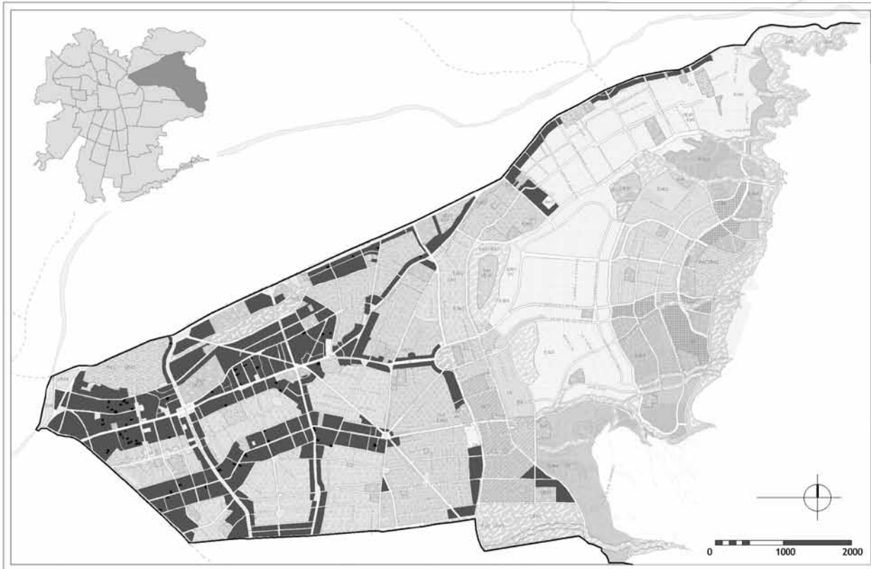
FIGURA 1: PLANO DE LA COMUNA DE LAS CONDES SEÑALANDO LAS ZONAS DE APLICACIÓN DE LA NORMATIVA DE PREDIO EXISTENTE RESIDUAL DE DENSIFICACIÓN E IDENTIFICACIÓN DE LOS PREDIOS