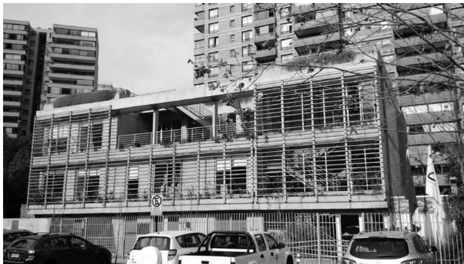
FIGURA 6: CENTRO SOCIAL, ILUSTRE MUNICIPALIDAD DE LAS CONDES UBICADO EN AVDA. ALONSO DE CÓRDOVA NRO.5225