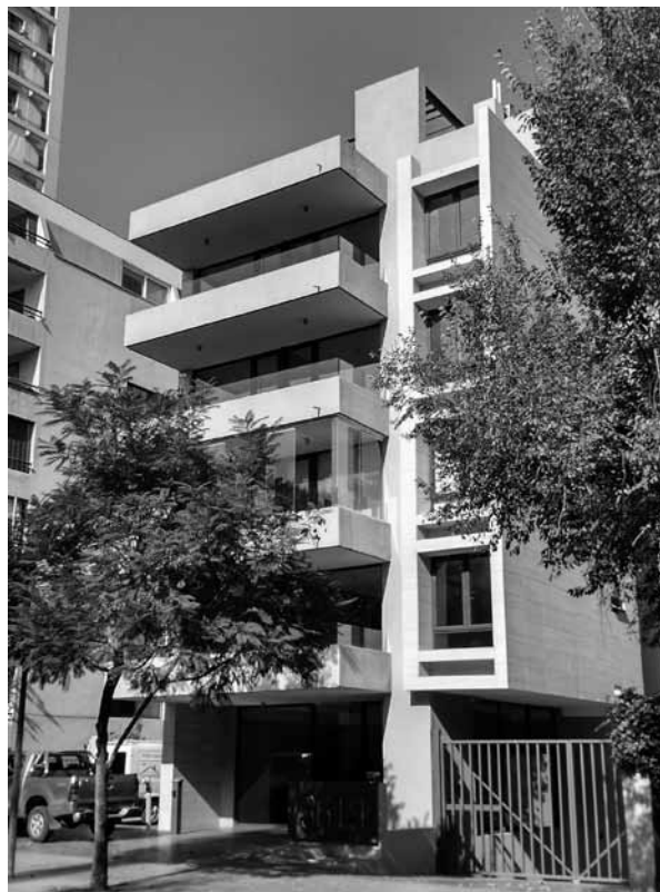
FIGURA 8: EDIFICIO CON DESTINO HABITACIONAL UBICADO EN AVDA, PRESIDENTE RIESCO NRO.3619.