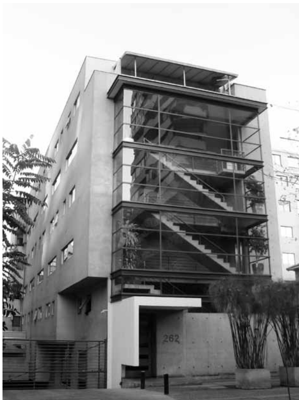
FIGURA 7: EDIFICIO CON DESTINO HABITACIONAL UBICADO EN CALLE CARMENCITA NRO.262.