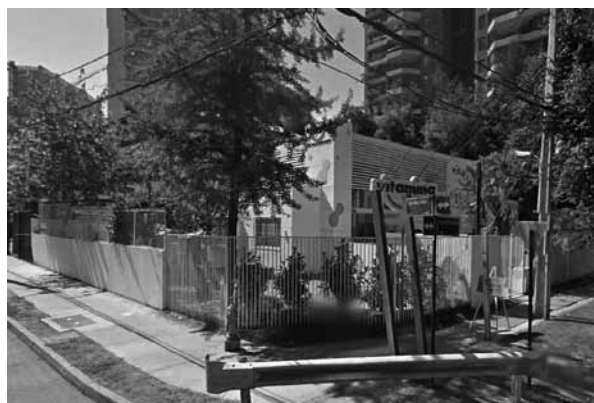
FIGURA 5: SALA CUNA Y JARDÍN INFANTIL UBICADO EN CALLE FLOR DE AZUCENAS NRO.145.