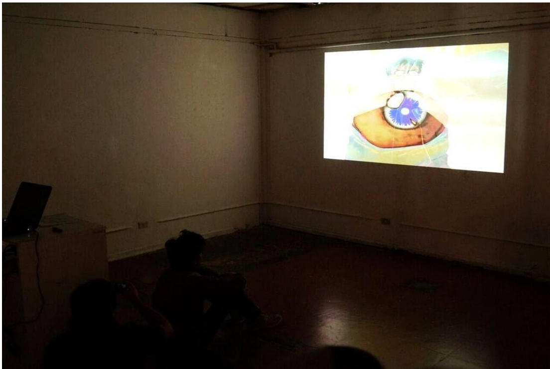
Figura 20 y 21. Proyección de "Neon Génesis Evangelion", performance. (Año 2015).