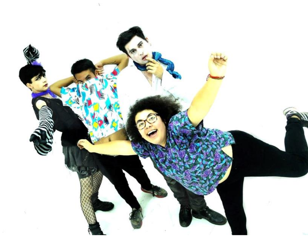
Figura 17: Grupo “1920”, performance. (Año 2016).