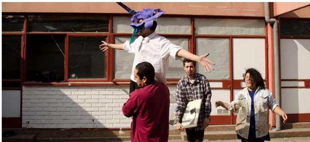
Figura 10, 11 y 12: "Prédica sin Práctica", performance. (Año 2014).