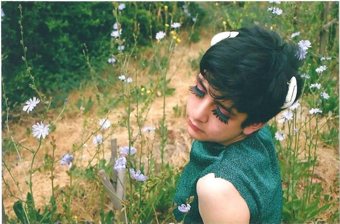
Figura 13: Personaje de evangelion con pinches.