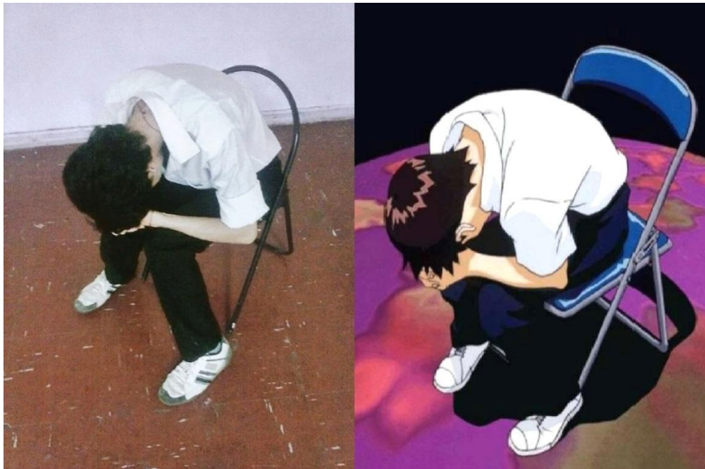
Figura 5: "Fuera de Foco", viñeta. (Año 2010).