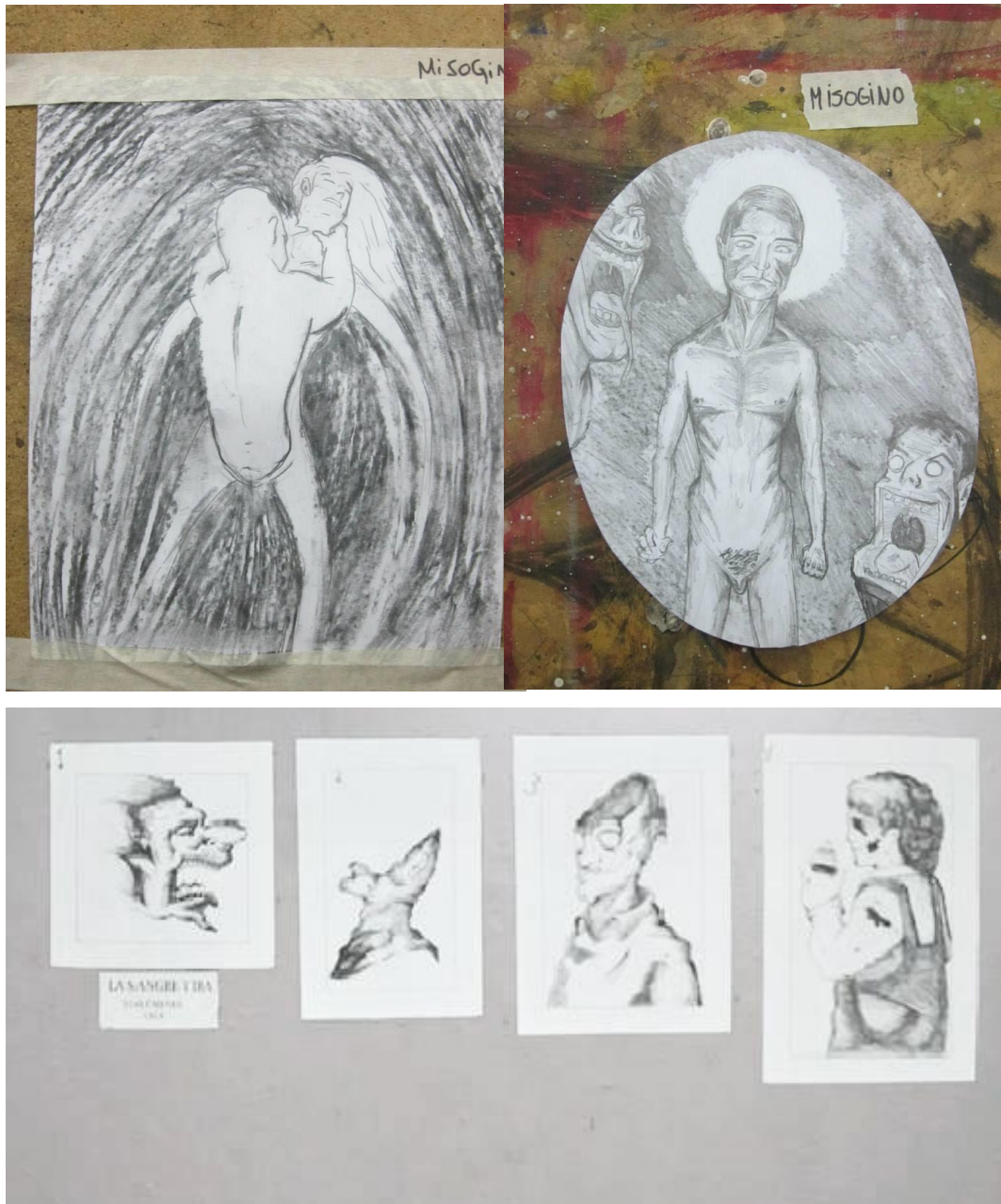
Figura 7 y 8: "Brain Panic", dibujos. (Año 2013)