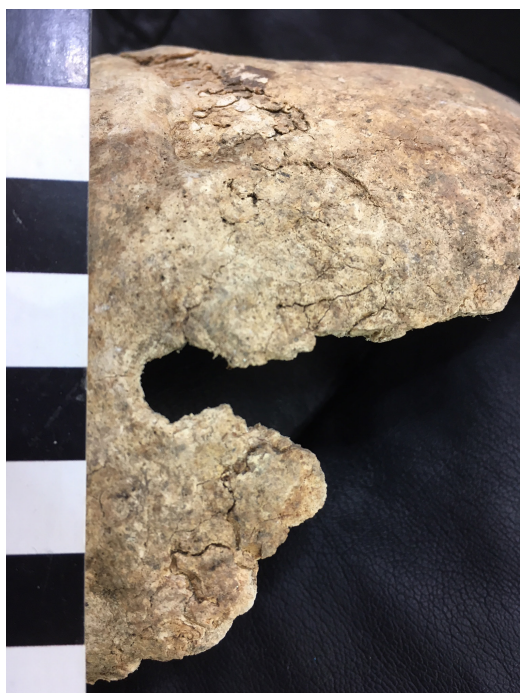
Figura 8. Cráneo con probable lesión por entrada de proyectil de arma de fuego

Skull with probable lesion by entrance of firearm projectile.