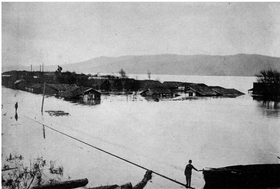
Figura 5. Inundación de fines de siglo XIX en Pedro de Valdivia.

Los individuos y los conjuntos óseos se encontraban, en términos generales, en un estado de conservación de Regular a Muy Malo, por lo que a pesar de que el tratamiento de recuperación privilegió el trato digno y respetuoso hacia los restos humanos, la fragilidad de los mismos resultó en una importante pérdida de material óseo, especialmente en vértebras, costillas y las epífisis de los huesos largos y un alto grado de fragmentación en todas las unidades óseas recuperadas. Así, la mayor información la hemos obtenido de la observación macroscópica de las diáfisis de los huesos largos y de las piezas dentales, que poseen los mejores grados de conservación, por lo que los diagnósticos que se presentan a continuación corresponden a apreciaciones poblacionales, toda vez que el análisis individual de los restos presenta vacíos, privilegiando aquellas características que nos parecen reflejan de mejor manera a los antiguos habitantes de la Misión San José de la Mocha durante su ocupación.