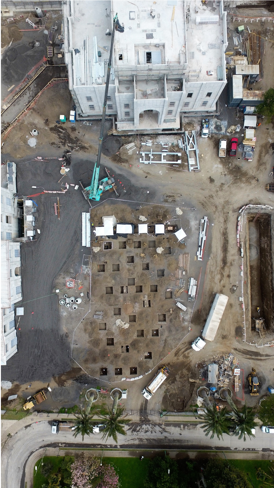
Figura 2. Área excavada en el sitio Quinta Junge. Excavated area in the site Quinta Junge.