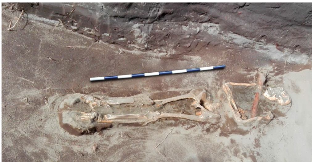
Figura 6. Presencia de raíz afectando a un contexto funerario.

Presence of a root damaging a funerary context.