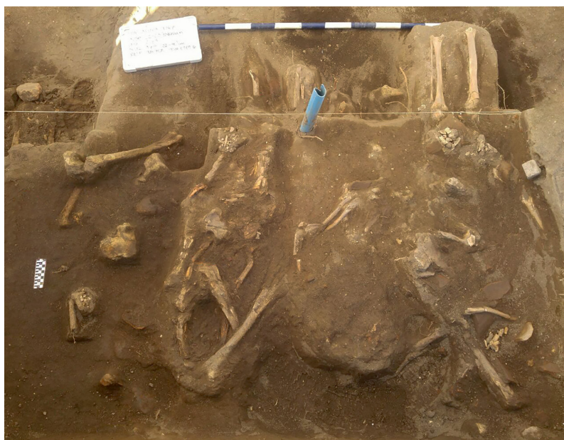
Figura 3. Vista general de uno de los conjuntos descubiertos. General view of one of the recovered bone assemblages.