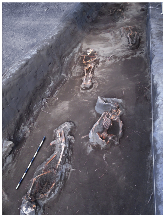
Figura 4. Área funeraria con algunos entierros in situ. Funerary area with some in situ burials.