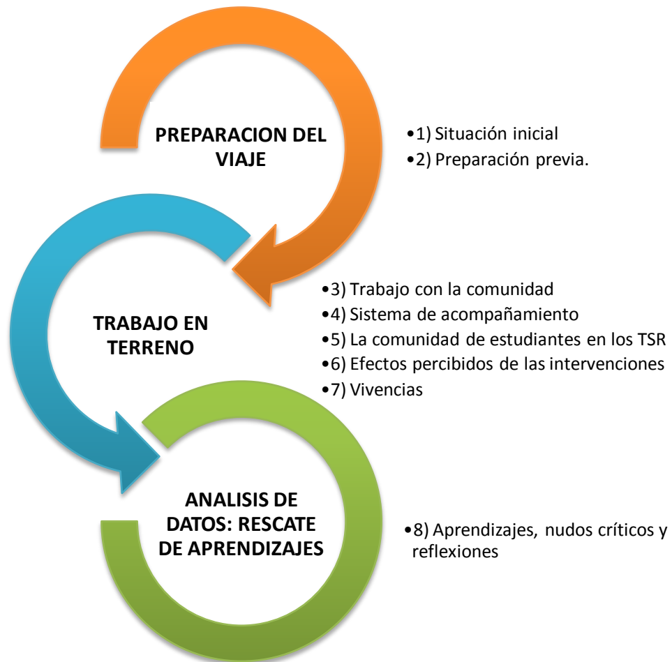
Figura 6. Fases del proyecto “Trabajos de Salud Rural”, enseñadas junto con las categorías trabajadas en el análisis, las que se muestran como momentos dentro de un mismo proceso.