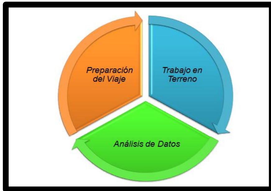
Figura 2: Fases del proyecto “Trabajos de Salud Rural”.

Fuente: Extraído del estudio de Paula Rodríguez: Psicología en el voluntariado “Trabajos de Salud Rural”. Aproximación de una apuesta en común, 2019.