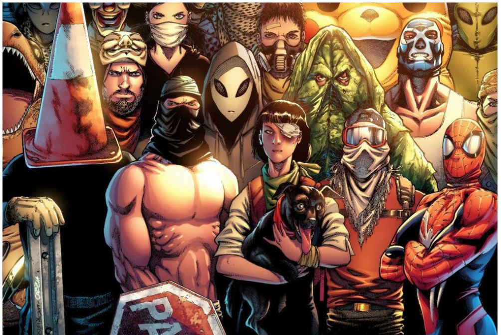
Figura 7 Los Avengers chilenos. Dibujo de CABZ y Mr. Marsupial, https://www.chvnoticias.cl/trending/negro-matapacos-pareman-baila-pikachu-manifestaciones-chile_20191116/ , 2019