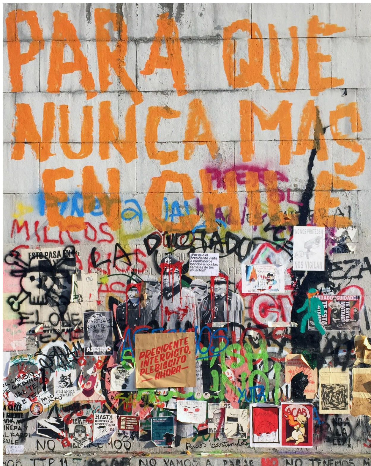
Figura 1 Zócalo Balmaceda.