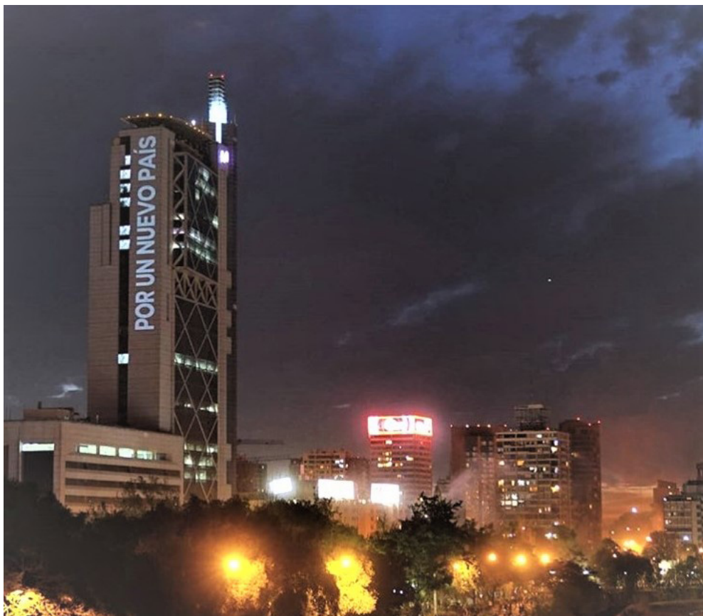
Figura 9 Por un nuevo país, Edificio Telefónica Chile, Santiago de Chile, Delight Lab Estudio, https://www.instagram.com/p/B40eQle-JT1r/?igshid=a5go-7de5x4wa

de las demandas ciudadanas, dejando sobre el Monumento al General Baquedano la palabra "PAZ". El horario en que se instala es al amanecer, por lo que no existió una interacción con la ciudadanía. Su fugaz existencia es conocida mediante un registro fotográfico y un video. La Academia de Líderes Católicos de Chile podrían ser sus autores.