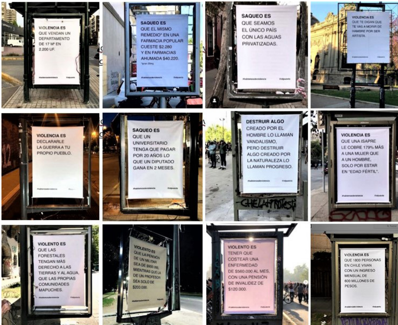
Figura 8 #hablemosdeviolencia, colectivo, @elpueblo https://www.instagram.com/elpueblo/ , 2019