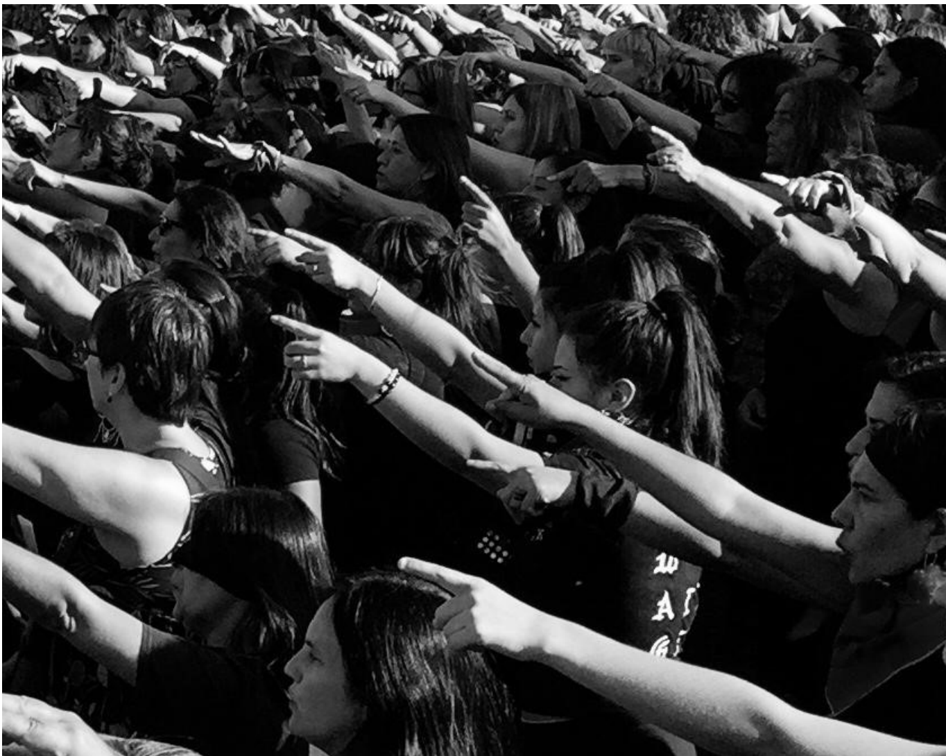
Figura 5 El Violador en tu Camino, Colectivo Las Tesis. 2019

Por cierto que el fenómeno comunicacional de LasTesis, es bastante más complejo de analizar que solo mediante su expresión performática. En tal sentido, la repercusión que ha tenido a nivel mundial es la capacidad de identificarse con el mensaje. Prueba de aquello es que en cada país donde se ha reproducido, ha sufrido adaptaciones adecuándose al contexto local, universalizando aún más su mensaje.