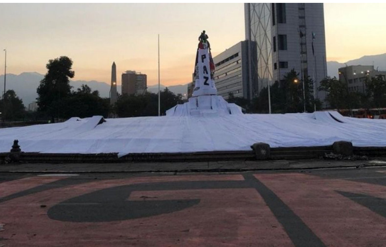
Figura 10 Instalación PAZ, autor desconocido, Santiago de Chile, https://twitter.com/T13/status/1195315357134790657