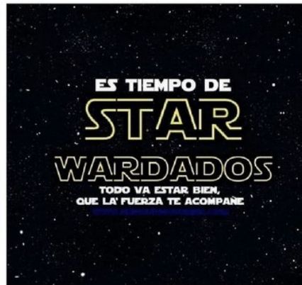
Pandemia galáctica. - Los memes tienen un capítulo especial en este archivo.

Universidad de Chile habilitó sitio en internet para que todos hagan su aporte