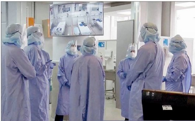
Galería de fotos. - Una de las fotos que llegaron es de la Unidad Crítica Covid del Hospital Clínico de la Universidad de Chile.