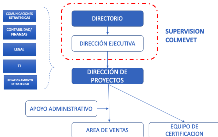
Figura 9: Organigrama Certifica Colmevet

A continuación se presenta el organigrama de Certifica Colmevet (ver anexo 16 con los perfiles de cargo):