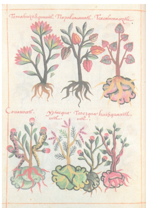
Figura 5. Temahuitztliauaitl. Tlapalcacauaitl. Texcalamacoztli. Couaxocotl. Yztacquauitl. Teoezquauitl. Huitzquauitl (De la Cruz, Libellus fol. 38v)

Algo similar acontece con las dos víboras entrelazadas a la planta llamada: Couaxocotl (Figura 5). La aglutinación de los términos coua-xocotl o víbora-fruta es muy clara en la iconografía. Ambas víboras se están alimentando de los frutos. Esto refuerza la inclusión de otros seres vivos, en este caso, reptiles que tienen a estas plantas como su hábitat. Destaca, además, las coloraciones de ambas y su disposición dual o complementaria. Es conveniente indicar la función medicinal de esta planta que, junto con otras, se sugiere para el tratamiento «Contra republicam administrantis et munus publicum gerentis fatigationem» 23 .