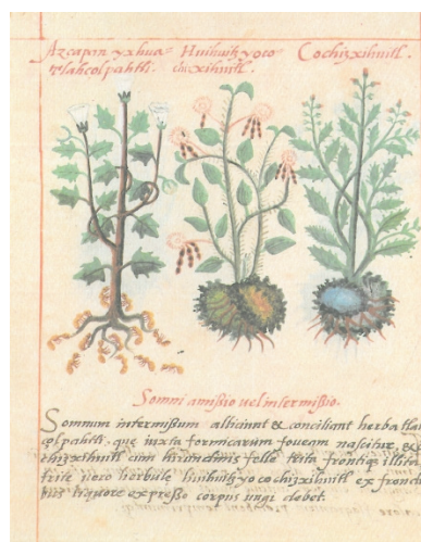
Figura 3. Azcapanyxhua tlahçolpahli. Somni amissio uel intermissio. Somnum intermissum alluciant et conciliant herba tlahçolpahli, quae iuxta formicarum foueam nascitur, et cochizxihuitl cum hirundinis felle trita frontique illita. Tritae uero herbulae huihuizyocochizxihuitl ex frondibus liquore expresso corpus ungi debet (De la Cruz, Libellus , fol. 13v)