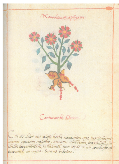
Figura 4. Nonochton Azcapanyxhua. Contra cordis dolorem. Cui cor dolet aut calefit, herba nonochton, quae iuxta formicarum cauum nascitur, aurum, electrum, teoxihuitl, chichiltic tapachtli et tetlahuitl cum corde cerui combusto atterentur in aqua. Succus bibetur (De la Cruz, Libellus fol. 28r)