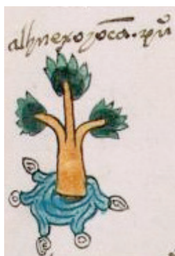
Figura 2. Glifo toponímico: Alhuexoyocan (Códice Mendoza [1541], fol. 26r)

El primer ejemplo es la planta llamada Acamallotetl (Figura 1) tiene un uso medicinal específico para la curación de las quemaduras de los niños. Acorde al Libellus es útil contra la siriassis. Junto con otras hierbas el Libellus receta su preparación a través de una medicina hecha con tierra blanquecina que se recoge del fondo de los ríos «ex albida terra, albidis lapillis qui ex fundo fluminis colliguntur». En la imagen se distingue claramente a la planta y sus partes: flor, tallo y raíces, y por debajo de estas se aprecia con color azul el glifo nahua para el agua, atl tal como se expone en el Códice Mendoza (Figura 2) con el glifo toponímico para Alhuexoyocan (lugar lleno de sauces de agua), similitud entre ambas imágenes es visible. No es complejo comprender que este glifo está siendo utilizado para referir al río donde buscar la tierra blanquecina, dejando claramente establecida la continuidad de los códigos culturales nahuas como vehículo de comunicación de ideas. Entonces, pensamos en el uso de este glifo como un complemento visual que el receptor será capaz de comprender de forma evidente. El uso del glifo atl o agua es decidor puesto que es fácil de reconocer para un receptor europeo y, además, permite integrar de contrabando 22 elementos nahuas en el repertorio iconográfico del Libellus .