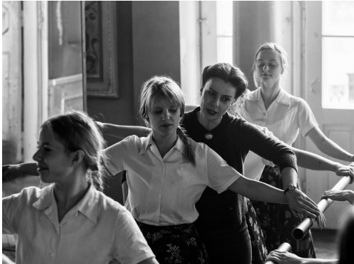
Cold War (2018)