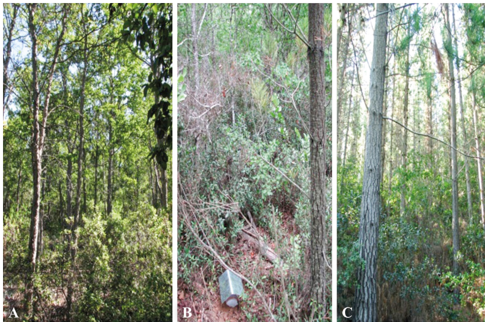
Figura 2. Tipos de hábitats estudiados. A. Bosque de Nothofagus glauca . B. Plantación de Pinus radiata . C. Formación Mixta (Hualo- pino), Centro Experimental Dr. Justo Pastor León, Predio Pantanillos, Constitución, Región del Maule, Chile.