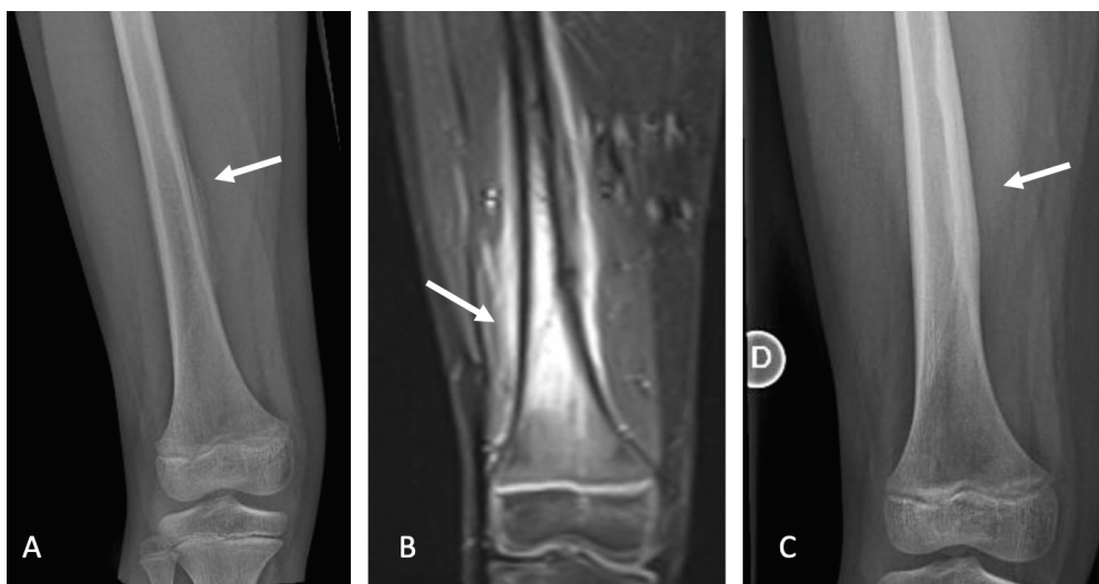
Figura 3. Fractura por estrés de fémur

Paciente de sexo masculino 9 años con dolor progresivo de muslo derecho luego de práctica intensiva de fútbol. A. Radiografía de fémur derecho con reacción perióstica (flecha). B. Imagen de resonancia magnética de fémur derecho con edema óseo y rasgo de fractura por estrés. C. Radiografía de fémur derecho 3 meses de evolución, con formación de callo óseo y fractura consolidada.