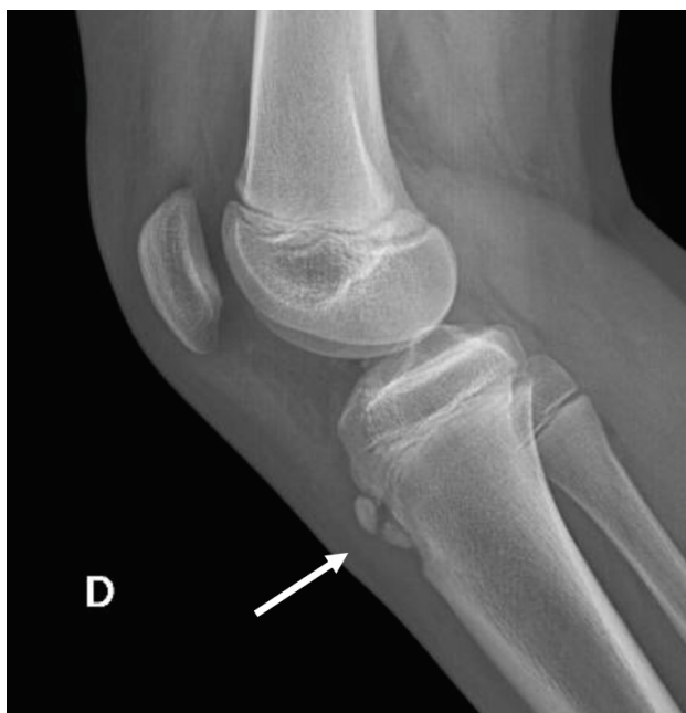
Figura 1. Enfermedad de Osgood Schlatter

Radiografía lateral de rodilla con fragmentación de apófisis de la tuberosidad anterior de la tibia (flecha) en paciente de sexo masculino de 14 años portador de enfermedad de Osgood Schlatter.