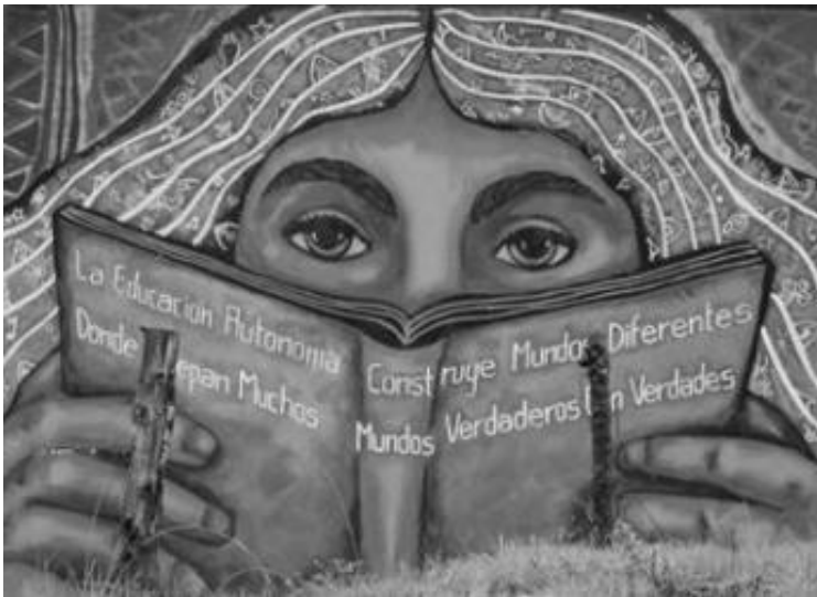
(Mural Escuela Primaria Rebelde Autónoma Zapatista)