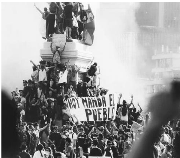
(Plaza de la Dignidad, 2019)