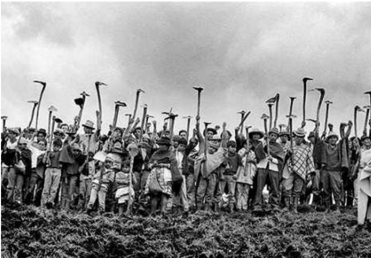
(Revolución Boliviana, 1952)