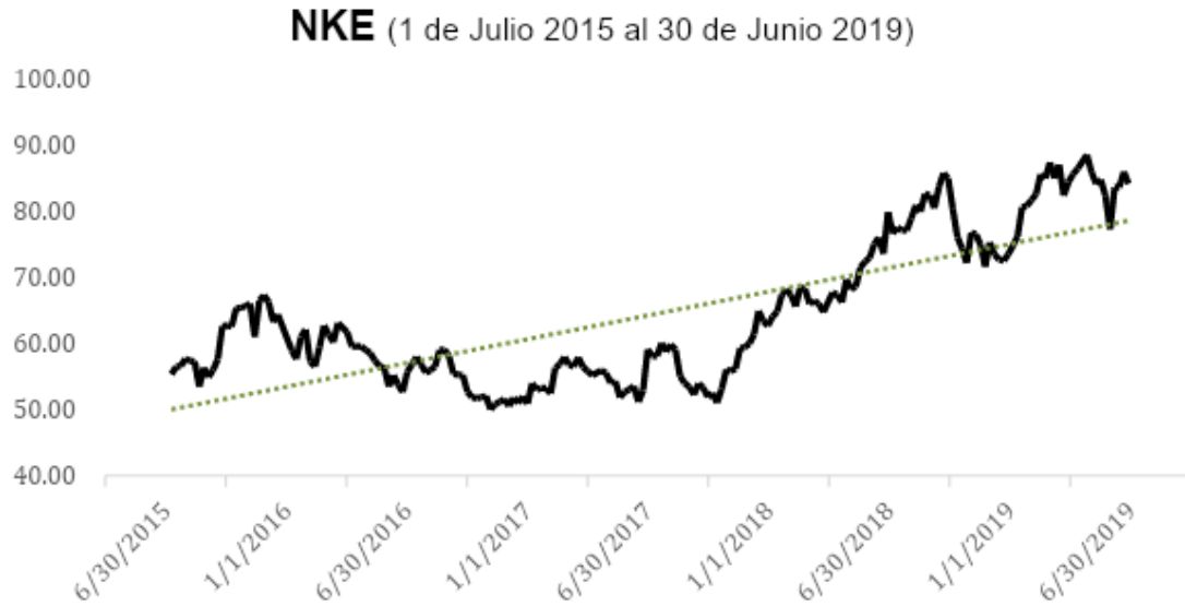
Ilustración 6 – Precios semanales para NKE