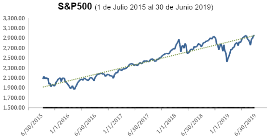
Ilustración 7 – Precios semanales S&P500