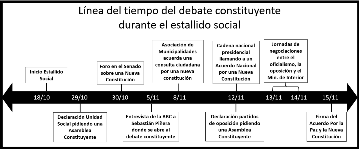
Línea del tiempo 2.-Hitos del Estallido Social, desde su inicio, hasta el Acuerdo por la Paz Social y la Nueva Constitución

Más allá de las repercusiones inmediatas y del convulsionado ambiente, la ruta marcada en la madrugada del 15 de noviembre siguió su curso, en virtud de lo cual, nueve días más tarde de la firma, se materializó el punto 10 del mismo, con la presentación de las 14 personas que integraron la Comisión Técnica encargada de traducir el Acuerdo por la Paz y la Nueva Constitución en un proyecto de reforma constitucional, completando sus vacíos e incluso proponiendo significativas innovaciones. El análisis del trabajo de este grupo será el objeto central del próximo capítulo.