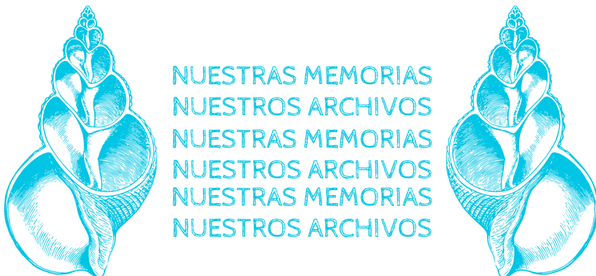
Diseños de la portada del sitio web de Proyecto Paitocas