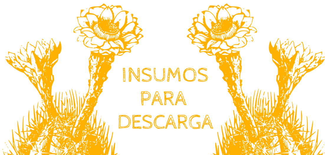
Portada pestañas de descargas