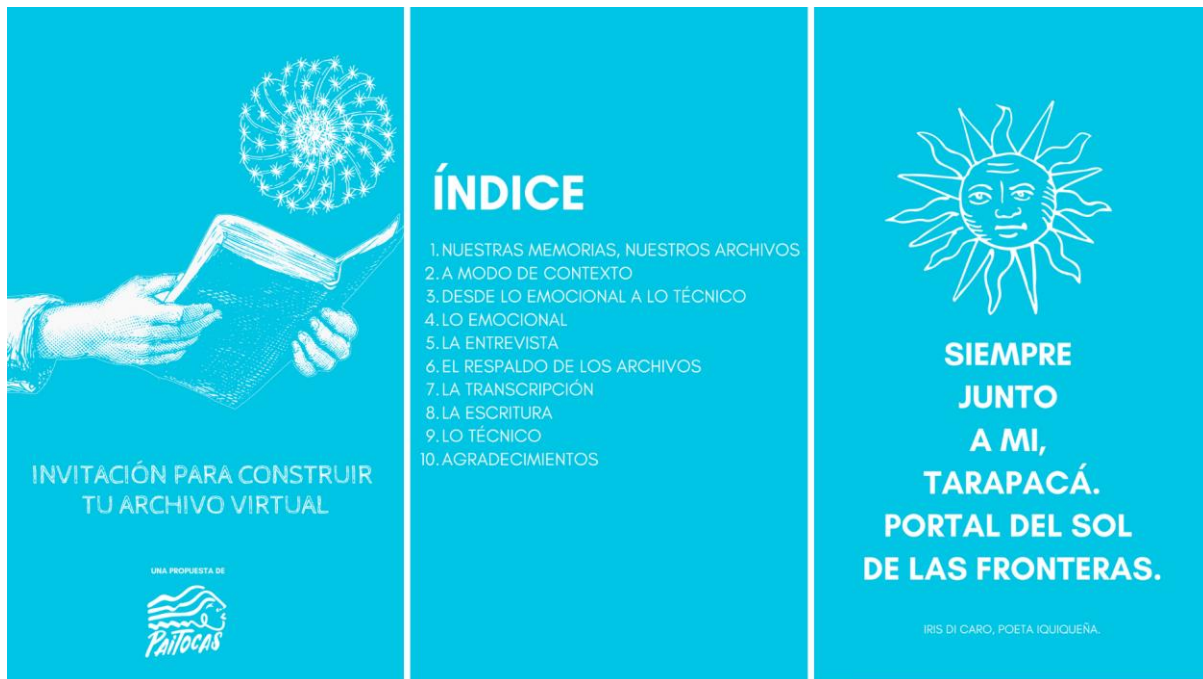
Portada, índice y presentación.

A continuación, puede revisar una muestra de la guía. Este documento se encuentra adjunto a esta entrega y también puede ser consultado desde https://proyectopaitocas.cl/descargas/ . La diagramación y diseño fue elaboración propia.