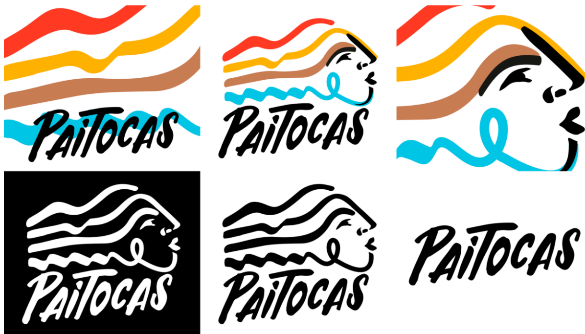
Variaciones del logo de Proyecto Paitocas. Elaboración propia.

El logo de Proyecto Paitocas es una mujer con la mirada al futuro, mientras que desde sí misma surgen los colores que representan cualidades geográficas de la región, debido al vínculo colectivo entre identidad y paisaje.