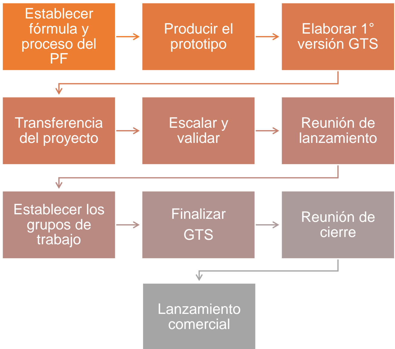
Figura 6: Panorama general de transferencia de conocimientos

La Figura 6 esquematiza el diagrama de flujo de la transferencia de conocimientos.