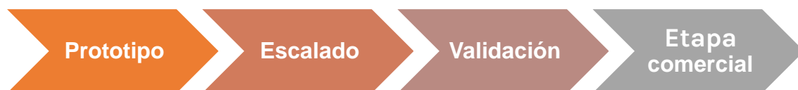
Figura 2: Fases del desarrollo farmacéutico de un PF en SCL

La Figura 2 muestra un esquema de las fases del desarrollo farmacéutico y la posterior etapa comercial.