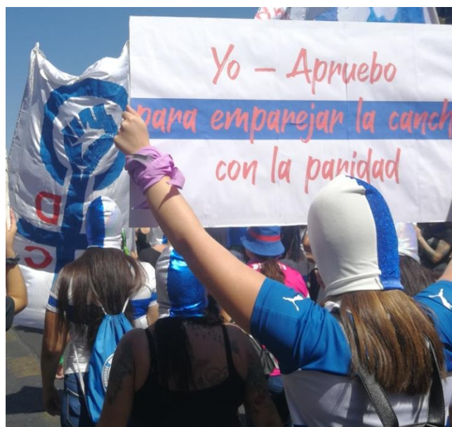
Figura 6: Cartel “Yo – Apruebo, para emparejar la cancha con la paridad”

la elite chilena y a la iglesia católica, con los cuales la agrupación no comparte afinidad. Es por esto que encontrarse en este lugar significa para la agrupación poder reivindicar de manera crítica dicho espacio. Se observan también los colores del club, dispuestos en banderas, camiseta, capuchas y cuerpos pintados. Banderas que también comparten mensajes tales como “contra el macho y el facho” y rostros de mujeres como Gladys Marín (dirigenta histórica del Partido Comunista chileno) y Violeta Parra (cantautora chilena, creadora de la canción “gracias a la vida” canción que la hinchada de Universidad Católica homenajea y agrega “gracias a la vida, por ser cruzado”). Elementos que dan cuenta de politización también antifascista y anticapitalista. Mientras que las capuchas, como se mencionó antes, adquieren un significado de lucha, también asociado a lo vivido el 2019 durante el estallido social.