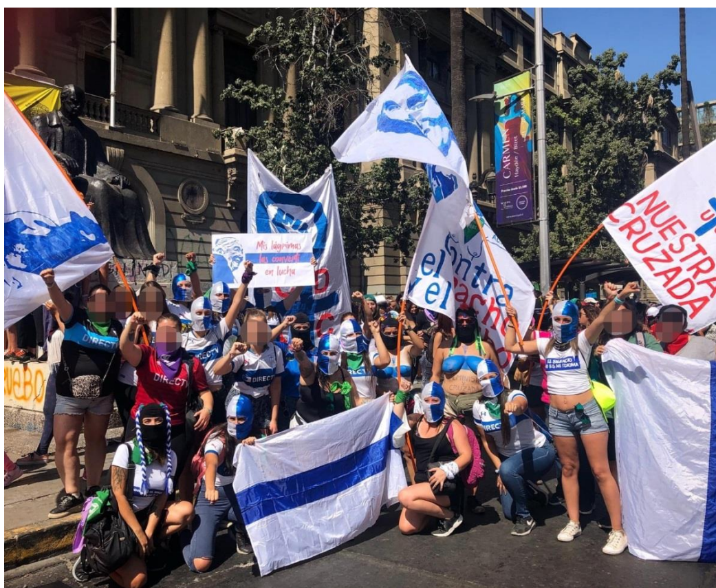
Figura 5: Nuestra Cruzada en la conmemoración del 8 de marzo del 2020

símbolos o pintados alusivos tanto al club como a su agrupación. Por lo mismo, también se ven acompañadas de lienzos y banderas que llevan los colores del equipo junto a las consignas sociales y políticas por las cuales juntas se movilizan para la transformación, tal como se puede apreciar en la Figura 5, obtenida en la marcha conmemorativa del Día Internacional de la Mujer, el 8 de marzo del 2020.