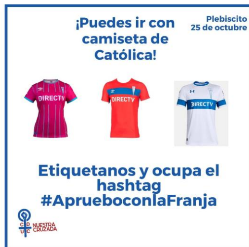
Figura 7: Instagram, 25 de octubre 2020

Como se observa en la figura 7, Nuestra Cruzada hizo un llamado especial para el día del sufragio, en donde se invitó a asistir al proceso con la camiseta o símbolos que representaran a “la franja” (Club Deportivo Universidad Católica), al mismo tiempo que, se invitaba a votar por la opción del Apruebo y compartir dicha participación por redes sociales a través del hashtag #AprueboconlaFranja para que desde las redes sociales de la agrupación se fueran compartiendo. Desde aquí, se vuelve a destacar la importancia identitaria que tiene el ser hincha a la hora de participar en procesos políticos como el plebiscito, estallido social, y la galería de los estadios, de manera de siempre poder resaltar estas vivencias como sujetas hinchas de fútbol.