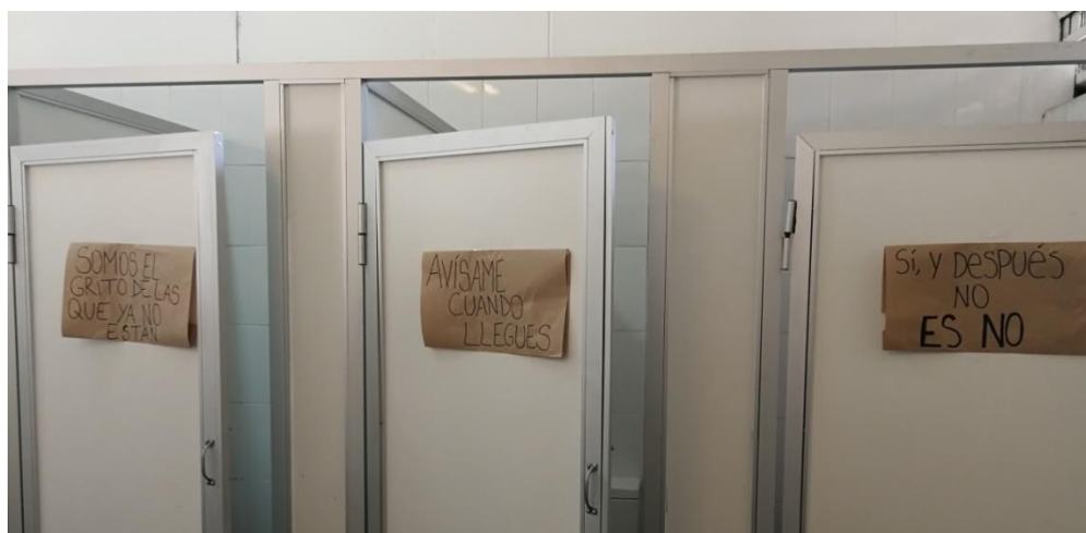
Figura 1: Carteles alusivos a luchas feminista.

En la Figura 1, podemos ver carteles dispuestos en los baños donde se llevó a cabo la “1ra Feria Feminista Nuestra Sororidad”, en la que participaron distintas mujeres emprendedoras a través de realización de talleres y venta en stands. En los carteles se aprecian mensajes alusivos a las luchas feministas contra la violencia de género y sexista: “Somos el grito de las que ya no están”, “Avísame cuando llegues”, “Si, y después no, Es No”. Este evento da cuenta del valor que NC le entrega a la colaboración feminista a través de la articulación de espacios propios y separatistas que problematizan las lógicas patriarcales, tal como lo fue esta feria (diario de campo, 14 de Marzo 2020).