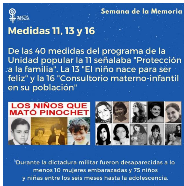
Figura 4: Instagram, 7 de septiembre 2020

La Figura 4 muestra parte de las acciones que realizaron durante septiembre, donde a través de sus canales de comunicación, recordaron ideales de lucha de las personas que fueron asesinadas, desaparecidas y torturadas durante la dictadura, con el fin de dar cuenta que esos deseos por cambiar el país siguen latentes. En el ejemplo de la figura, se muestra una de las medidas #11, #13, #16 respecto a la protección familiar que proponía la Unidad Popular previo al golpe de estado de 1973, luego la imagen realiza un quiebre en la información señalando el vuelco dado durante la dictadura, dando cuenta de las mujeres embarazadas y NNA que fueron víctimas de este periodo. Otras medidas compartidas fueron la #27 que implicaba la investigación a la colusión de precios entre las farmacéuticas, medida #7 respecto a las jubilaciones justas, medida #8 sobre descanso justo y medida #9 sobre previsión para todos. Desde estas publicaciones, las hinchas buscaron visibilizar lo contingente que siguen siendo estas problemáticas en la actualidad y que fueron parte de lo que llevó a la revuelta del 18 de octubre de 2019.