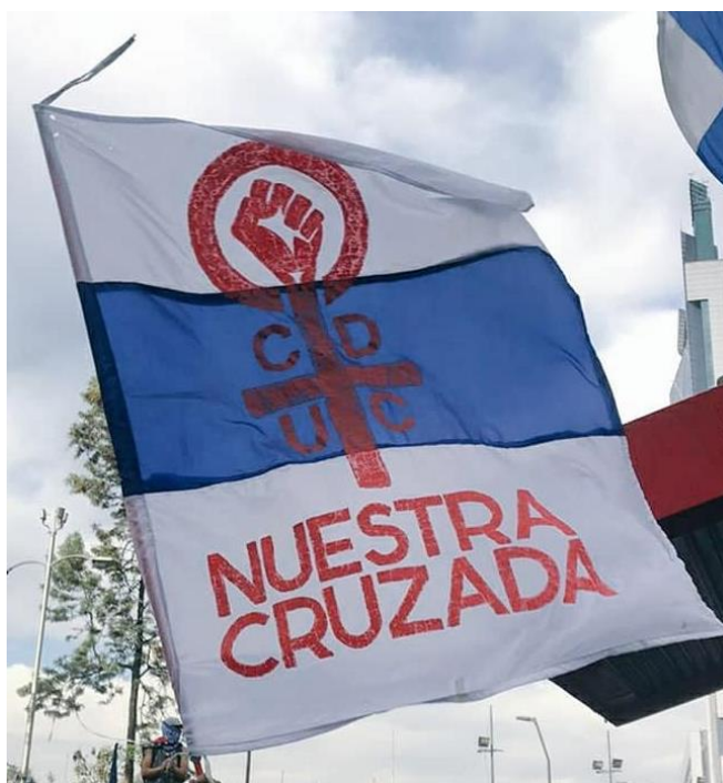
Figura 4: Bandera Nuestra Cruzada

además queda sellado con el propio nombre “Nuestra Cruzada”, que a su vez hace alusión a la batalla contra el patriarcado como objetivo de la agrupación de hinchas del club que históricamente ha nombrado a sus jugadores e hinchas como “Los Cruzados”. Lo anterior, da cuenta de cómo los símbolos presentes en el fútbol se trasladan a escenarios de politización, mostrando la importancia que tiene para NC ser hinchas en búsqueda de un proyecto de transformación social.