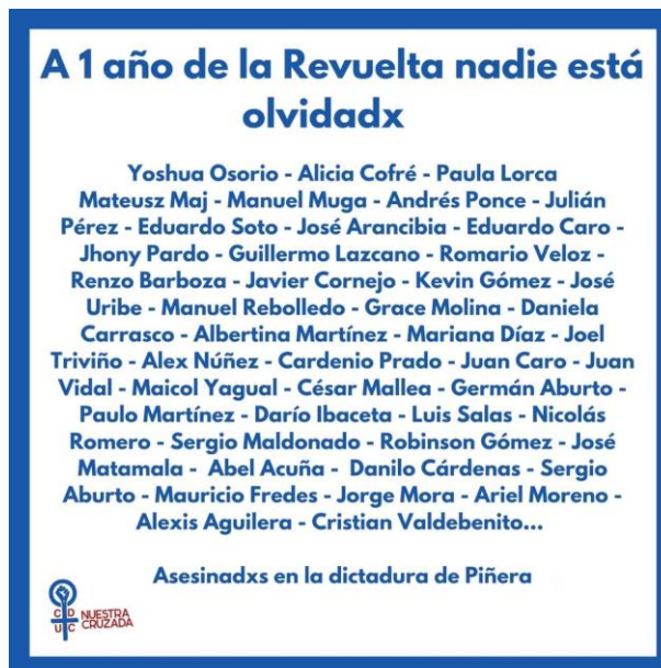
Figura 3: Instagram, 18 de octubre 2020

A pesar de la llegada de la pandemia mundial a principios del año 2020, Nuestra Cruzada siguió movilizándose desde otros espacios, principalmente virtuales a través de sus redes sociales, con el fin de seguir problematizando las contingencias a nivel nacional. Lo cual permite dar cuenta que si bien los espacios principales de encuentro y desarrollo de la agrupación (el estadio y la calle) se vieron afectados por la necesidad de resguardo sanitario, sus acciones y mensajes como agrupación no se vieron afectados. Desde aquí, la