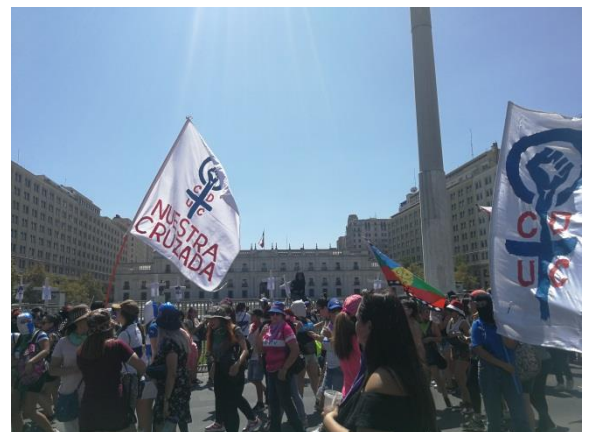
La Moneda, Marcha 8M 2020 (elaboración propia)