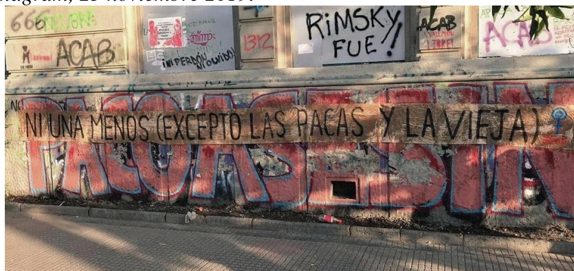
Figura 5: Instagram, 25 noviembre 2019.

En la imagen se aprecia la intervención realizada el 25 de noviembre, en el cual se conmemora el Día Internacional de la Eliminación de la Violencia contra la Mujer. En el empapelado dispuesto en Av. Providencia, a pocas cuadras de Plaza Dignidad, centro icónico de las manifestaciones durante el estallido social, se expone: “Ni una menos