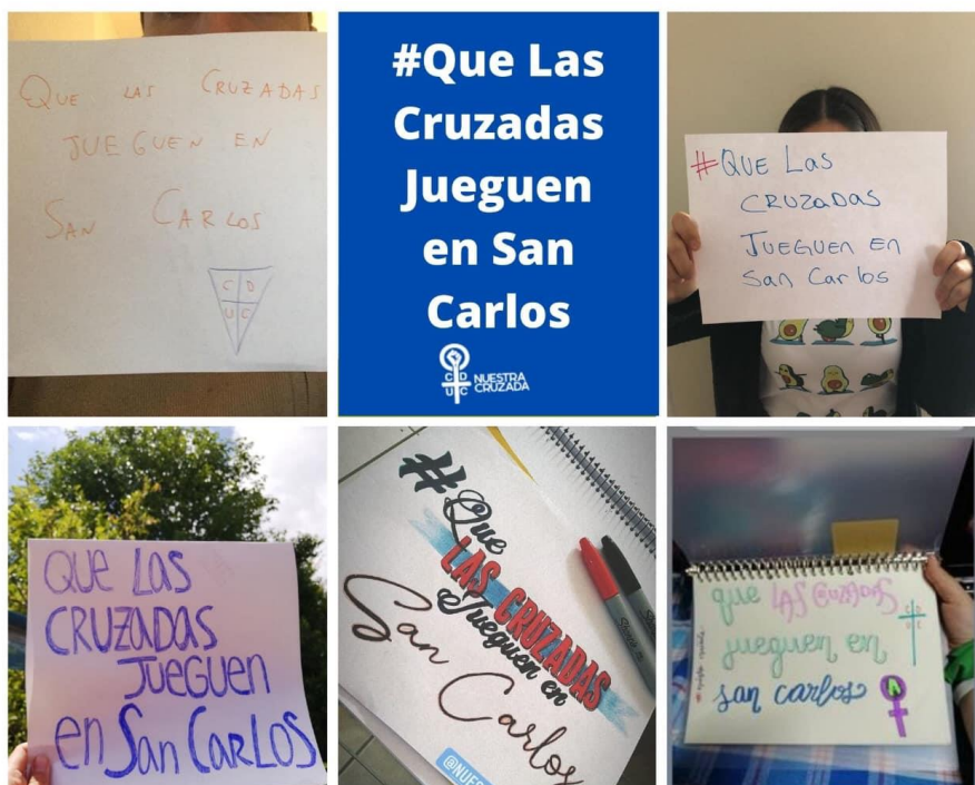
Figura 2: Campaña “Que las Cruzadas jueguen en San Carlos”