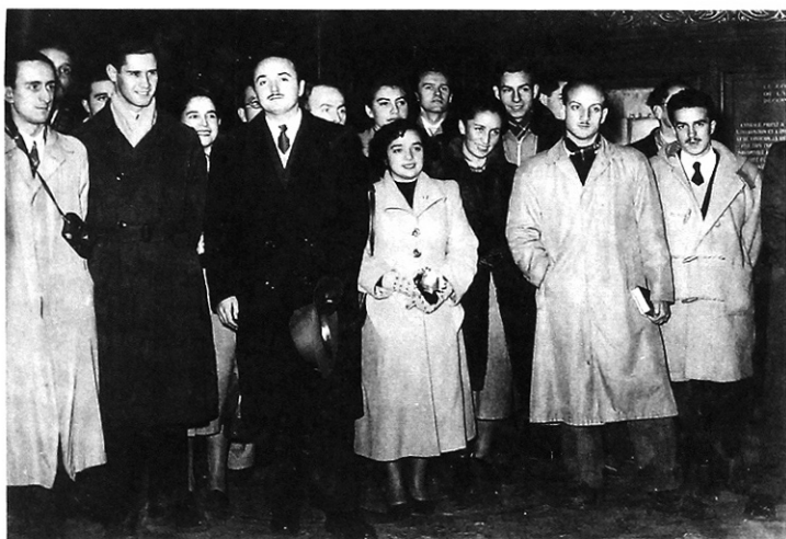
HOTEL DE VILLE (Municipalidad) de París. Escuchando al Alcalde...