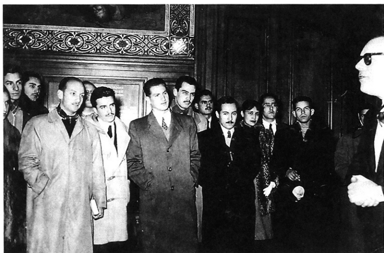
HOTEL DE VILLE. Seguimos escuchando al Alcalde...