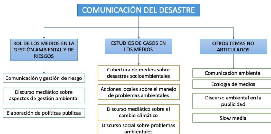
Figura 03: Mapa conceptual de la comunicación del desastre, elaboración propia.

Esquemáticamente, de lo que se habla cuando se escribe sobre comunicación del desastre, puede expresarse en la siguiente figura: