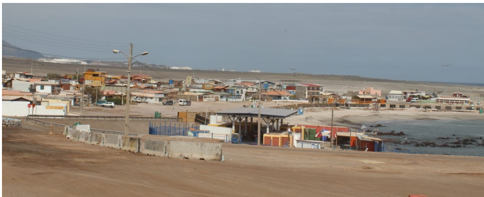
Caleta Chanavayita, región de Tarapacá.

“Acá el problema con las autoridades es que nos dejan abandonados. No hay un apoyo de las autoridades hacia nosotros. Prácticamente, hace unos años atrás, tuvimos que venderle el alma al diablo, como le decimos nosotros, trabajar con las mineras para poder tener progreso.”