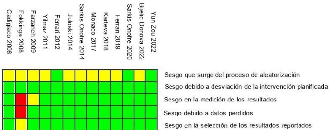
Figura N°2: Riesgo de sesgo de estudios clínicos aleatorizados (RoB2).

Para evaluar la calidad de los estudios clínicos aleatorizados se utilizó el software Risk of Bias 2 (RoB 2). (113) Como resultado, se obtuvo que 3 estudios poseen bajo riesgo de sesgo, 9 plantearon algunas inquietudes, y 1 fue catalogado como alto riesgo de sesgo.