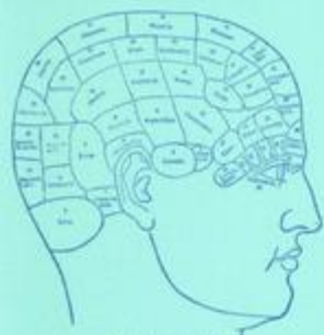
PROTHOMORPHIC HEAD of the Human Brain.