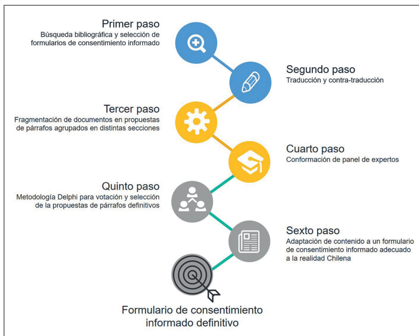
Figura 1. Flujograma de trabajo.

Los criterios de inclusión y exclusión de los