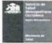
Comité ético-científico Servicio de Salud Metropolitano Occidente