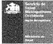
Comité ético-científico Servicio de Salud Metropolitano Occidente