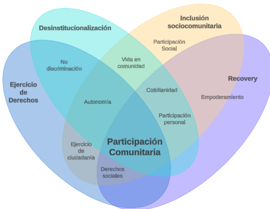
Figura 2. Esquema de comprensión de la Participación Comunitaria.

Bajo esta propuesta, es fundamental considerar la participación comunitaria como un eje transversal en la organización del HP. Estas estrategias, sin duda, deben apuntar hacia la mejora de la calidad de vida de las PsD psicosocial, la cual no sólo se mejora asegurando las condiciones básicas de infraestructura y manejo farmacológico, sino que también implica garantizar los derechos fundamentales que de la vida digna e independiente con la comunidad (7)(9). Para esto, la evidencia sugiere instrumentos que permiten evaluar el impacto de una intervención en la calidad de vida de las personas. Si nos situamos en el modelo de Calidad de Vida propuesto por Schalock y Verdugo, las estrategias deben considerar todas las dimensiones para limitar la transinstitucionalización, reducir el estigma y promover el retorno del rol socio-político de este grupo social. Estas dimensiones generan los pisos mínimos para favorecer la inclusión sociocomunitaria que involucra a la