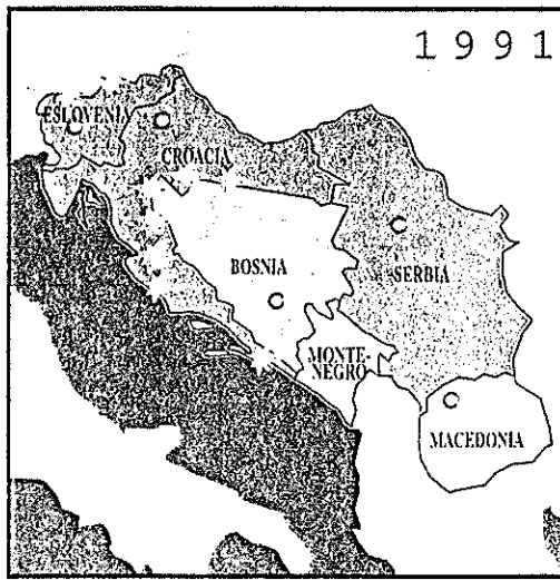
MAPA N° 3