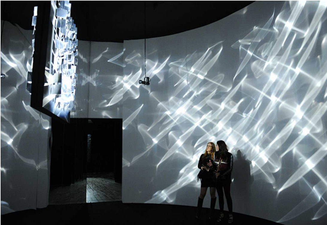
Imagen 3. Julio Le Parc, Luz en movimiento, 1962 (reconstrucción 2017).

respecto Ana María Guasch, citando el manifiesto del grupo, describe el actuar de estos artistas constatando lo que ellos buscan: