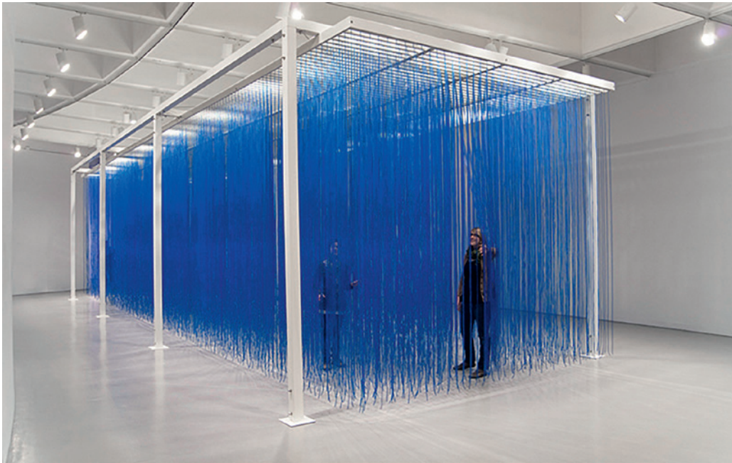
Imagen 2. Jesús Rafael Soto, Blue Penetrable, 1967 (reconstrucción 2012).