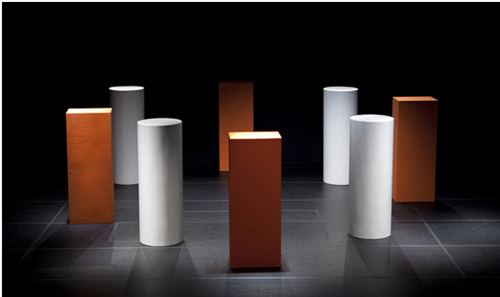
Imagen 4. Lygia Pape, Ballet NeoConcreto, 1958 (reconstrucción 2014).