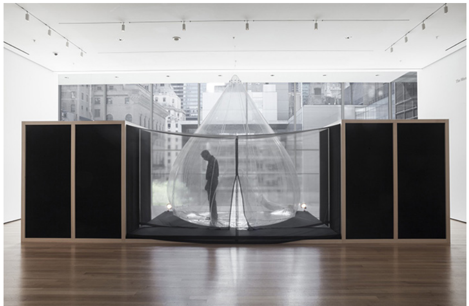
Imagen 6. Lygia Clark, La casa es el cuerpo: penetración, ovulación, germinación, expulsión, 1968 (reconstrucción 2014).

La pieza se compone de dos penetrables ejecutados anteriormente titulados PN2 La pureza es un mito (1966) y PN3 Imagético (1966-1967). Estas dos estructuras de madera pintada y cubiertas de telas fueron emplazadas en una extensa superficie de arena y grava sobre la cual se colocaron diversas plantas de origen