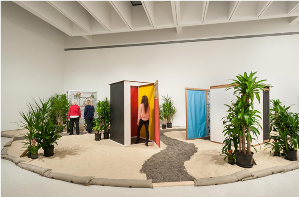
Imagen 8. Hélio Oiticica, Tropicália, 1967 (reconstrucción 2016). Fuente: Carnegie Museum of Art, Pittsburgh. https://www.galerielelong.com/exhibitions/helio-oiticica3/installation-views?view=slider#3

tropical. Por su parte, en una esquina del ambiente se instaló una jaula con cotorras junto a los poemas-objetos de Roberta Camila Salgado (Imagen 8).