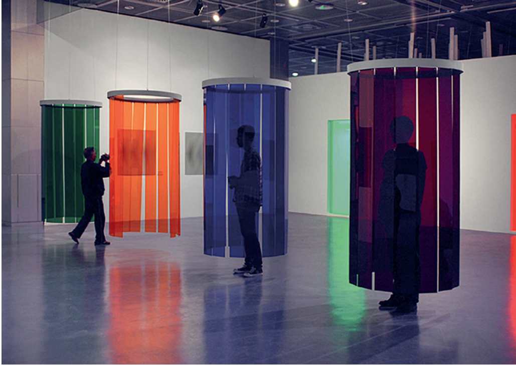
Imagen 1. Carlos Cruz-Diez, Douches d'Induction Chromatique , 1968 (reconstrucción 2012).