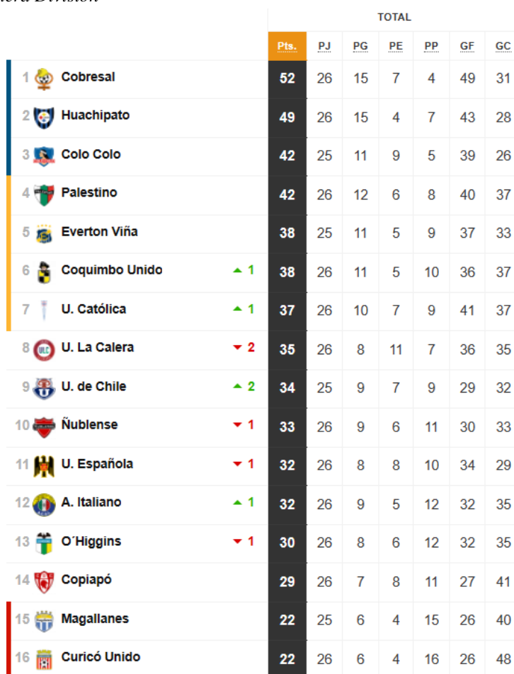
Tabla 1 Equipos Primera División

De los anteriormente mencionados, la Primera División es el campeonato más relevante a nivel nacional, organizado por la Asociación Nacional de Fútbol Profesional (ANFP). A continuación, se presentará una tabla con los equipos que lo componen, actualizada con la información para mediados de Octubre de 2023.